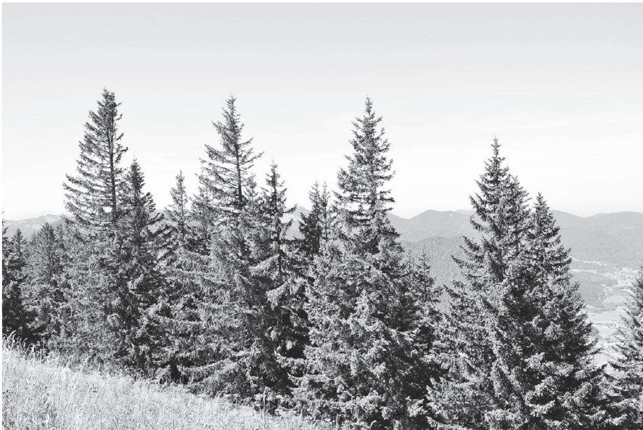
Fichtenwaldung am Tegernsee in 900 m Höhe über NN.