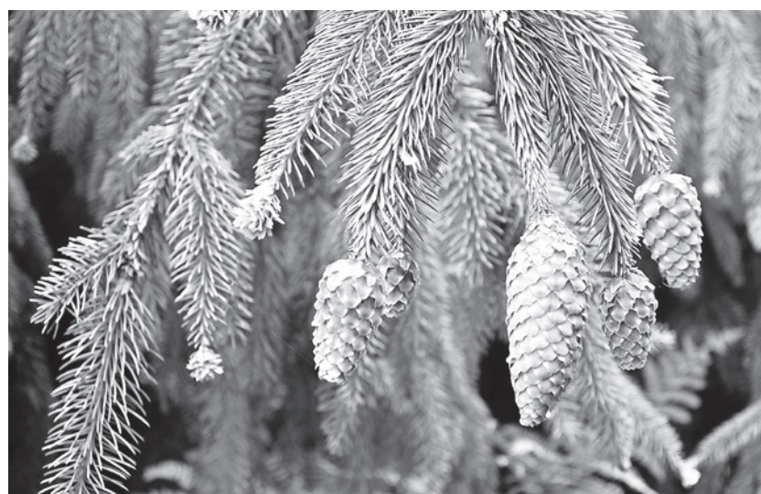
Die jungen Zapfen einer Fichte.

Fichten erreichen im freien Wachstum ein Alter von 400 bis 600 Jahren, im Kulturwald 150 Jahre. Der Jahreszuwachs beträgt in der Höhe 50 cm, in der Breite 6 bis 8 cm. Es kann ein Stammdurchmesser von 1,50 m erreicht werden.