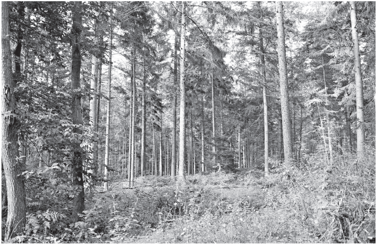
Fichtenbestand im Drangstedter Wald.

Sind unsere Böden, auf denen Fichten kultiviert werden, für diese Nadelpflanzen geeignet? Zunächst wachsen kleine, junge Pflanzen auf nahezu allen Böden erstaunlich gut an. Doch sobald sie größer und älter werden, zeigen sich Probleme. Moor- und Marschböden sind nicht „fichtenfreundlich“. Geestböden, die teilweise leicht anlehmig sind, erfüllen die Anforderungen für Fichten jedoch gut. Dank der Niederschläge und der oft hohen Luftfeuchtigkeit kommt unser Klima den Fichten entgegen. Die starken Winde beein-