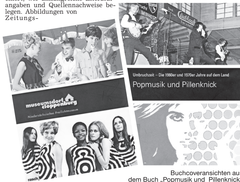
Buchcoveransichten aus dem Buch „Popmusik und Pillenknicke“