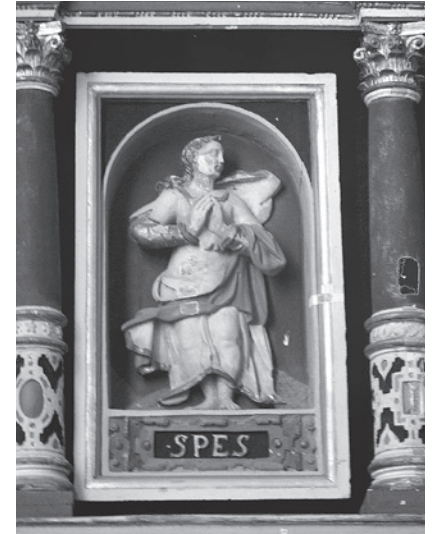
Darstellung der Tugend „Hoffnung“ in St. Urban in Dorum.

Urban handelt sich wohl um ein verborgenes Predigtprogramm der damaligen Dorumer Prediger.