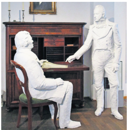
Szenen mit lebensgroßen Figuren, wie hier von den Stadtgründern Johann Smidt (sitzend) und Jacobus Johannes van Ronzelen, weisen in der Dauerausstellung auf historisch bedeutsame Ereignisse hin.

Die Stadt Bremerhaven stellte in mehreren jährlichen Raten 3,3 Millionen DM zur Verfügung, den Rest sollte das Museum aus Spenden finanzieren. Dies implizierte, dass die geplanten sieben Abteilungen der Dauerausstellung in Teilschritten fertiggestellt werden mussten, was angesichts der Personalsituation und der erforderlichen Exponatbeschaffungen auch nicht anders möglich war.