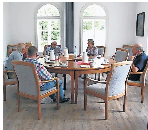
Gesprächsrunde zum Abschluss am Tag des offenen Denkmals.

Burg Morgenstern ging weiterhin die Gründung der Männer vom Morgenstern hervor. Auch die Idee der Neugestaltung des kleinen Gastraums gehört in diesen Zusammenhang.