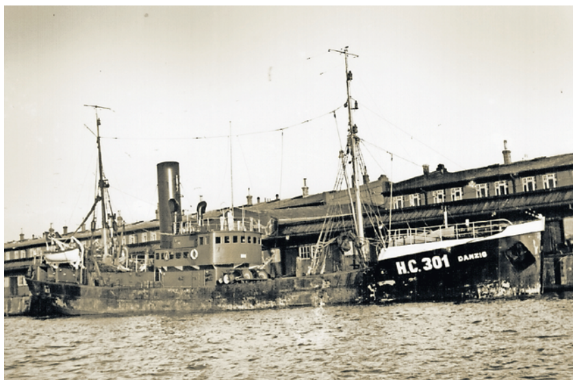
FD DANZIG 1937 im Cuxhavener Fischereihafen. Die DANZIG war das letzte Cuxhavener Fischereifahrzeug, dem das Fischereikennzeichen „HC“ erteilt wurde.