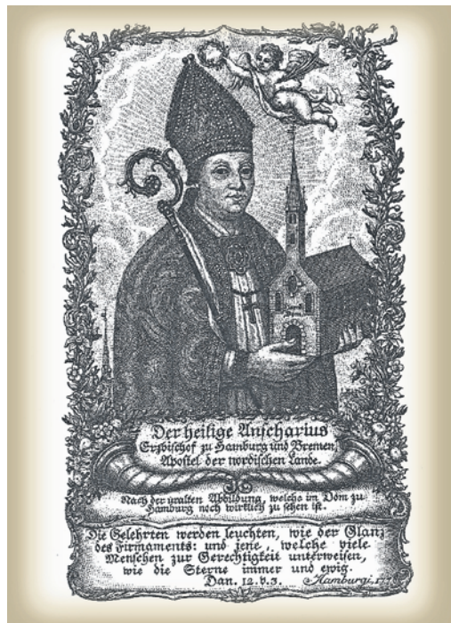
Der Heilige Ansgar auf einem Kupferstich aus dem Jahre 1778. (Abbildung: Staats- und Universitätsbibliothek Hamburg)