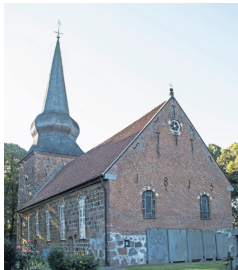
Die Capper Kirche.