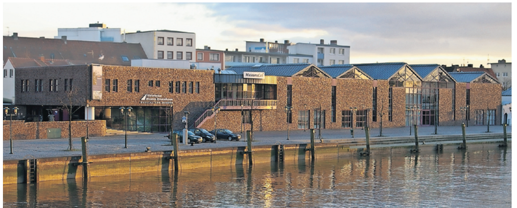
Gebäude und Dauerausstellung des Historischen Museums Bremerhaven an der Geeste erhielten mehrere Architektur- und Einrichtungspreise. (alle Abbildungen: Archiv Historisches Museum Bremerhaven).

Die Anschubfinanzierung leistete die Städtische Sparkasse aus ihrer Gewinnausschüttung. Die restlichen Mittel kamen aus dem Städtebauförderungsprogramm des Bundes und dem wirtschaftspolitischen Aktionsprogramm des Landes Bremen als einer EU-finanzierten Strukturverbesserungsmaßnahme, da das Areal zum Sanierungsgebiet erklärt wurde. Dadurch mussten für das Museumsgebäude aus dem städtischen Haushalt keine finanziellen Mittel zur Ver-