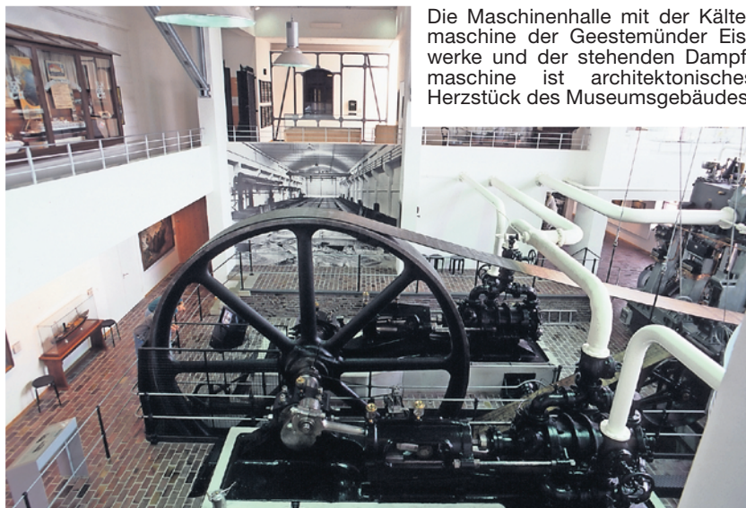
Die Maschinenhalle mit der Kältemaschine der Geestemünder Eiswerke und der stehenden Dampfmaschine ist architektonisches Herzstück des Museumsgebäudes.