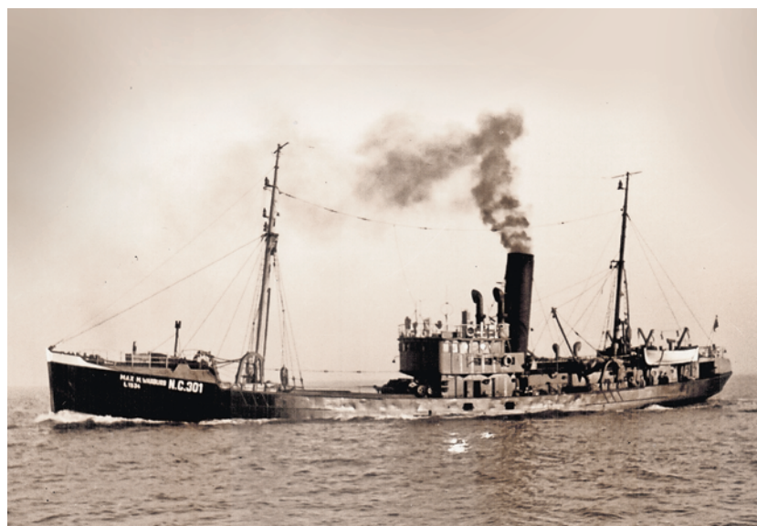
Ab Spätsommer 1945 wieder auf Fangreise: Die MAX M. WARBURG (ex DANZIG) um 1950 auf der Elbe vor Cuxhaven.