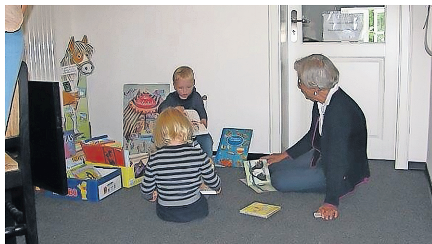
In der Bücherecke für Kinder.