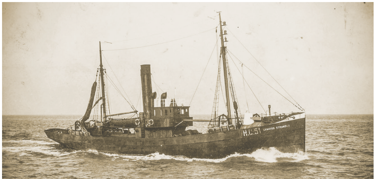
Seitenansicht des Fischdampfers SENATOR STRANDES.