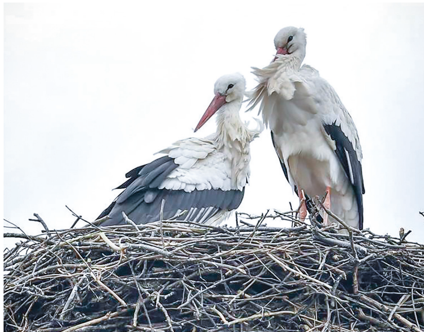
Ein Storchpaar in Laven im Jahr 2017.

Die Hiobsbotschaft, dass es ab dem Jahr 2000 keine Störche mehr bei uns geben würde, hat sich also erfreulicherweise nicht bewahrheitet.