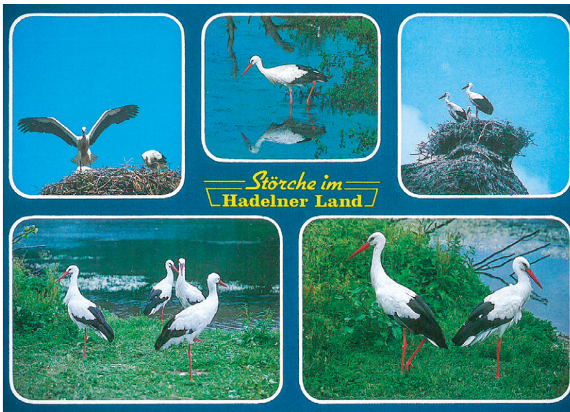
Postkarte mit Störchenmotiven.

Die Ursachen dafür waren Veränderungen der Landschaft mit dem Verschwinden offener Wasserläufe sowie eine gefährliche „Verdrängung“. Die Storchenbetreuer stellten fest, dass fast jeder zehnte Jungstorch schon vor dem Wegzug an einem Stromschlag starb, weil er sich auf einem der kleineren Überlandmasten niedergelassen hatte. Mit ihren langen Beinen und großen Flügeln gerieten die Vögel leicht in Schwierigkeiten, die oft tödlich ausgingen. Auch Fernsehantennen wurden den schwarz-weiß Gefiederten mit den 17 cm langen roten Schnäbeln zum Verhängnis. Inzwischen hat sich vieles zum Guten gewandelt. Die Überlandleitungen sind in die Erde verlegt worden und die Stromversorgungsunternehmen helfen nach Kräften beim Errichten von Masten als künstliche Nesthilfen.