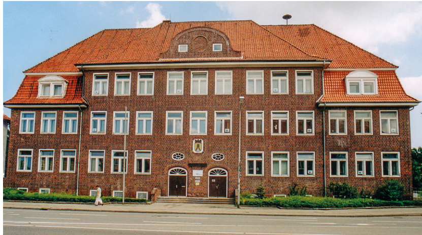
Die erste Jugendherberge in Cuxhaven war seit Juli 1920 in zwei Kellerräumen der Ritzebütteler Schule untergebracht.

Die Ritzebütteler Schule war zwar schon 1915 fertiggestellt, doch erst Ende 1919 für Unterrichtszwecke freigegeben worden. Nachdem die verwundeten und erkrankten Soldaten des in dem Gebäude eingerichteten Reserve-Lazarets entlassen worden waren, konnten die Schulkinder in ihre Klassenzimmer einziehen. Im Juli 1920 durften nahezu