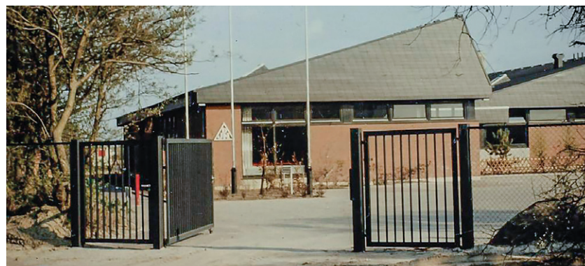
Jugendherberge in Duhnen im Jahr 1990.