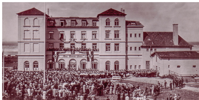
Einweihung und Eröffnung der Jugendherberge „Ove-Ovens-Haus“ in Duhnen im Jahr 1934.