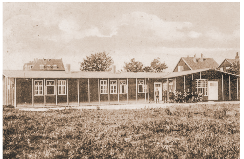
Jugendherbergsgebäude in der Poststraße in Cuxhaven.