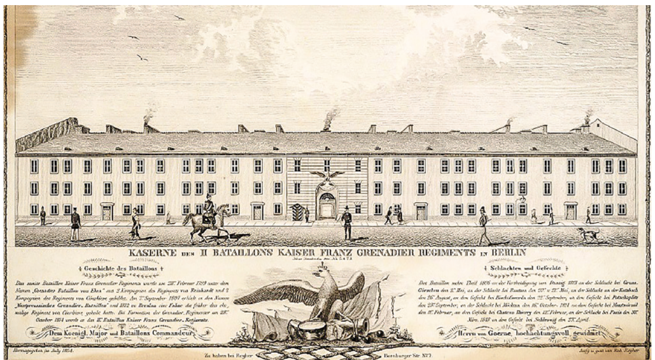
Stahlstich der Kaserne des Bataillons des Kaiser Franz Garde - Grenadier - Regiments in Berlin von Robert Reyher aus dem Jahr 1854.