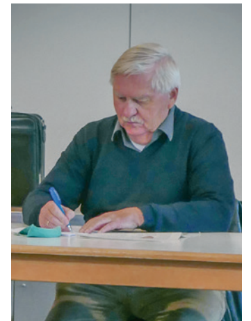
... und alles wird gewissenhaft protokolliert.