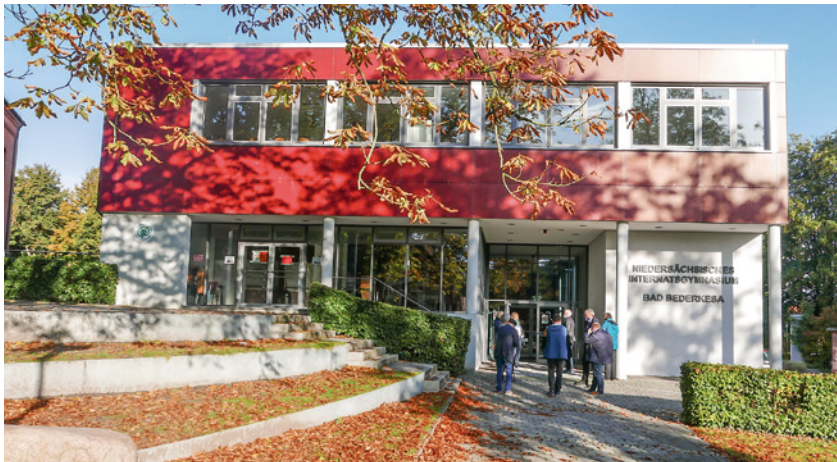
Im Forum des Niedersächsischen Internatsgymnasiums Bad Bederkesa fand die Mitgliederversammlung 2020 der Männer vom Morgenstern statt.

Bilder der Versammlung in Bad Bederkesa unter Corona-Bedingungen