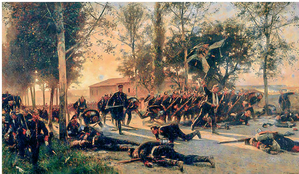
Gemälde von Carl Röchling „Tod des Majors von Hadeln“ mit einer Darstellung der Schlacht von Gravelotte am 18. August 1870. (Quelle: Wikicommons)