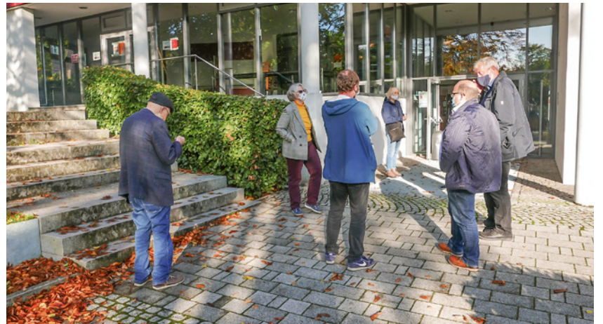
Die Vorsitzende im Gespräch mit Mitgliedern vor der Versammlung.