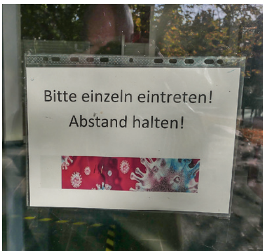
Ein wichtiger Hinweis in Zeiten von Corona.