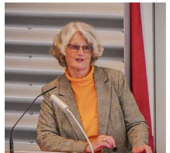
Auch der Bericht über das Vereinsgeschehen ist von Bedeutung.