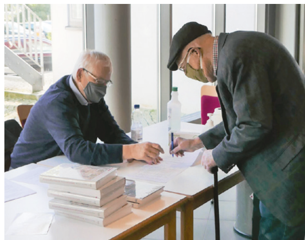
Eintragung in die Teilnehmerliste ist nicht nur in Zeiten von Corona wichtig.