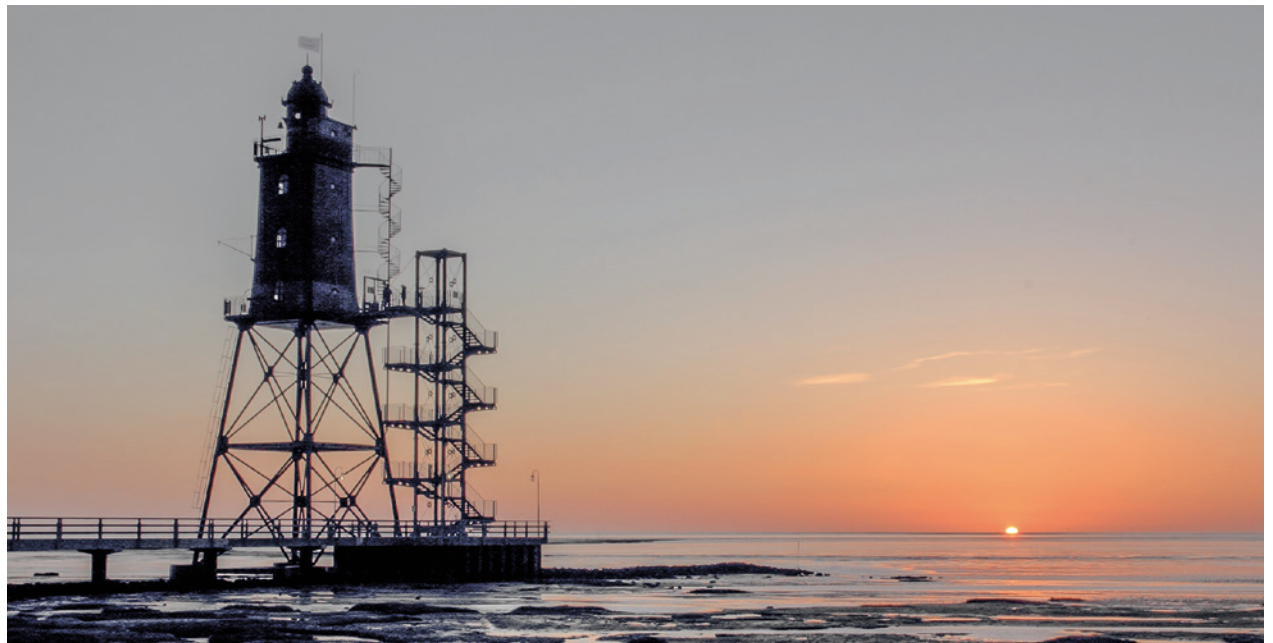
Der nach Dorum-Neufeld versetzte Leuchtturm Eversand Oberfeuer ist für Besucher zugänglich.

Nur zwei Jahre vor den Türmen im Wurster Watt sandte der von C. F. Hanckes gezeichnete Leuchtturm Roter Sand erstmals 1885 sein Licht über die Wesermündung. Außerdem gab es zwei Feuerschiffstationen in der We-