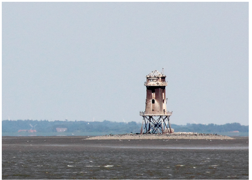
Der alte Leuchtturm Meyers Legde im Jahr 2014.