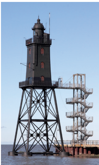
Der Leuchtturm Eversand Oberfeuer in Dorum-Neufeld im Jahr 2020.