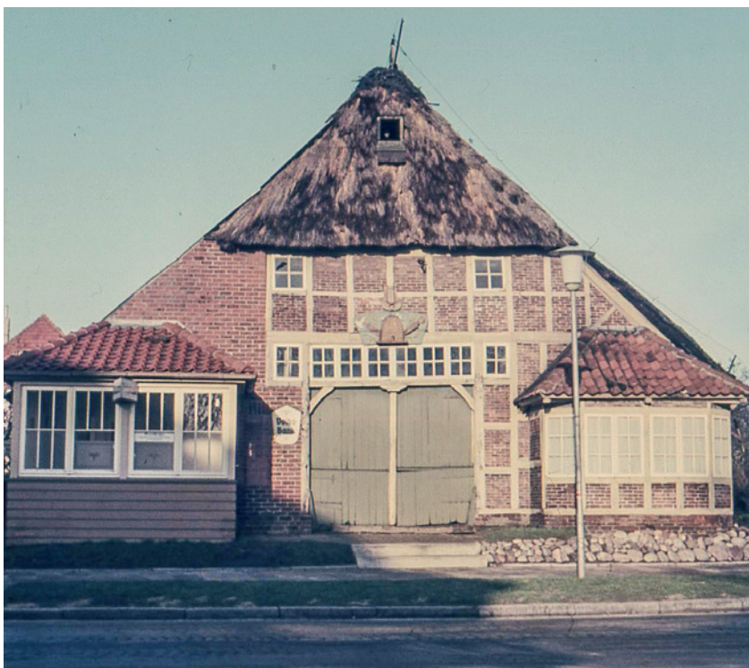
Das „Bienenkorbhaus“ in Duhnen im Jahr 1956.