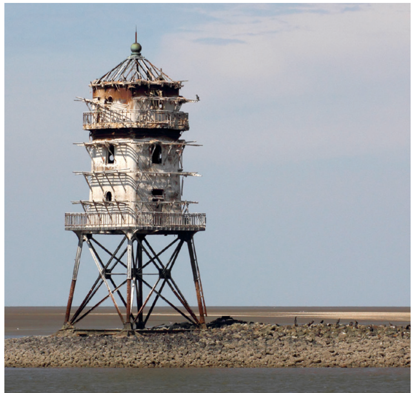
Leuchtturm Eversand Unterfeuer als „Kormoranturm“ im Jahr 2014.