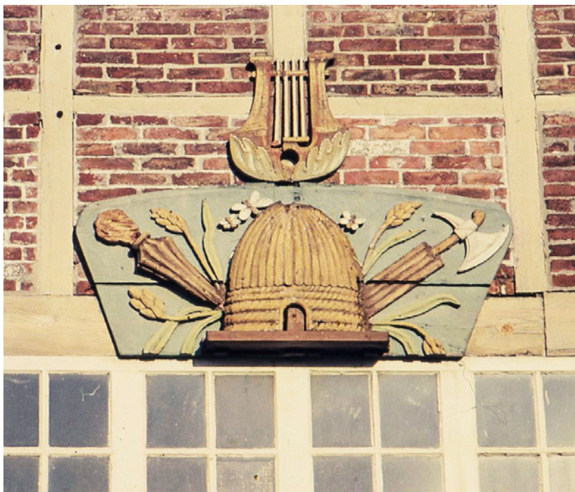
Das Bienenkorbschild des Hauses im Jahr 1956.