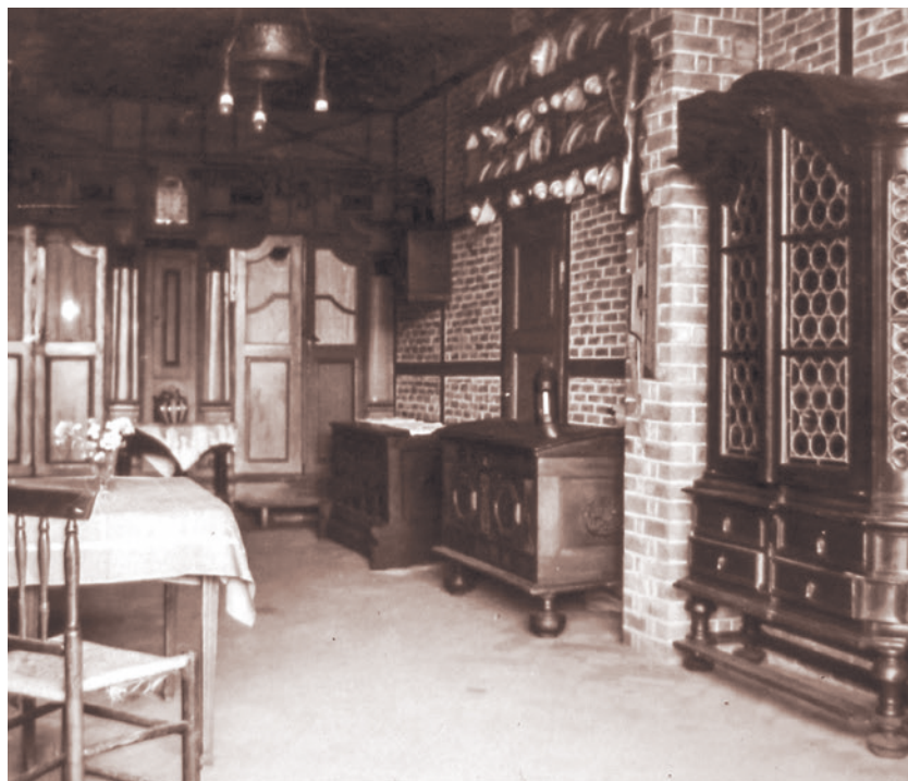
Blick auf die Inneneinrichtung des „Bienenkorbhauses“.