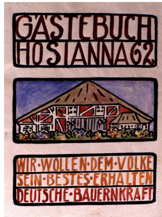
Gästebuch von „Haus Hosianna“ („Bienenkorbhaus“).