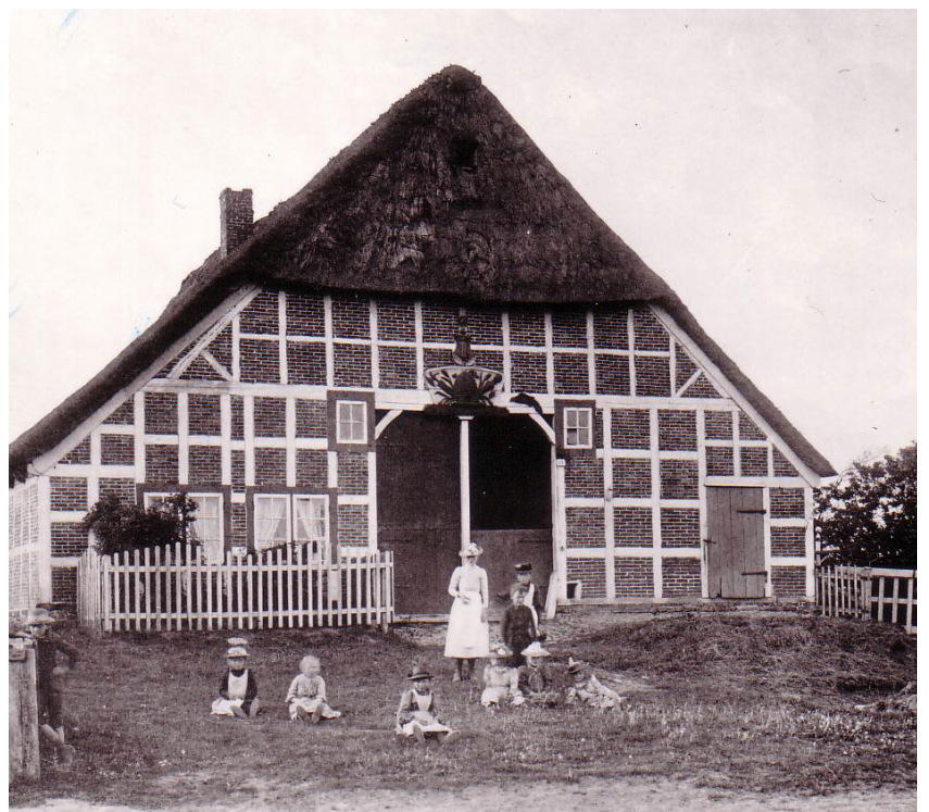
Das niedersächsische Hallenhaus im Jahr 1894 noch ohne Utlucht.