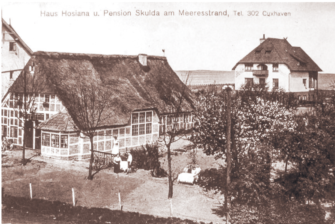
Das „Bienenkorbhaus“ (Haus Hosianna) und Haus Skulda um 1914.