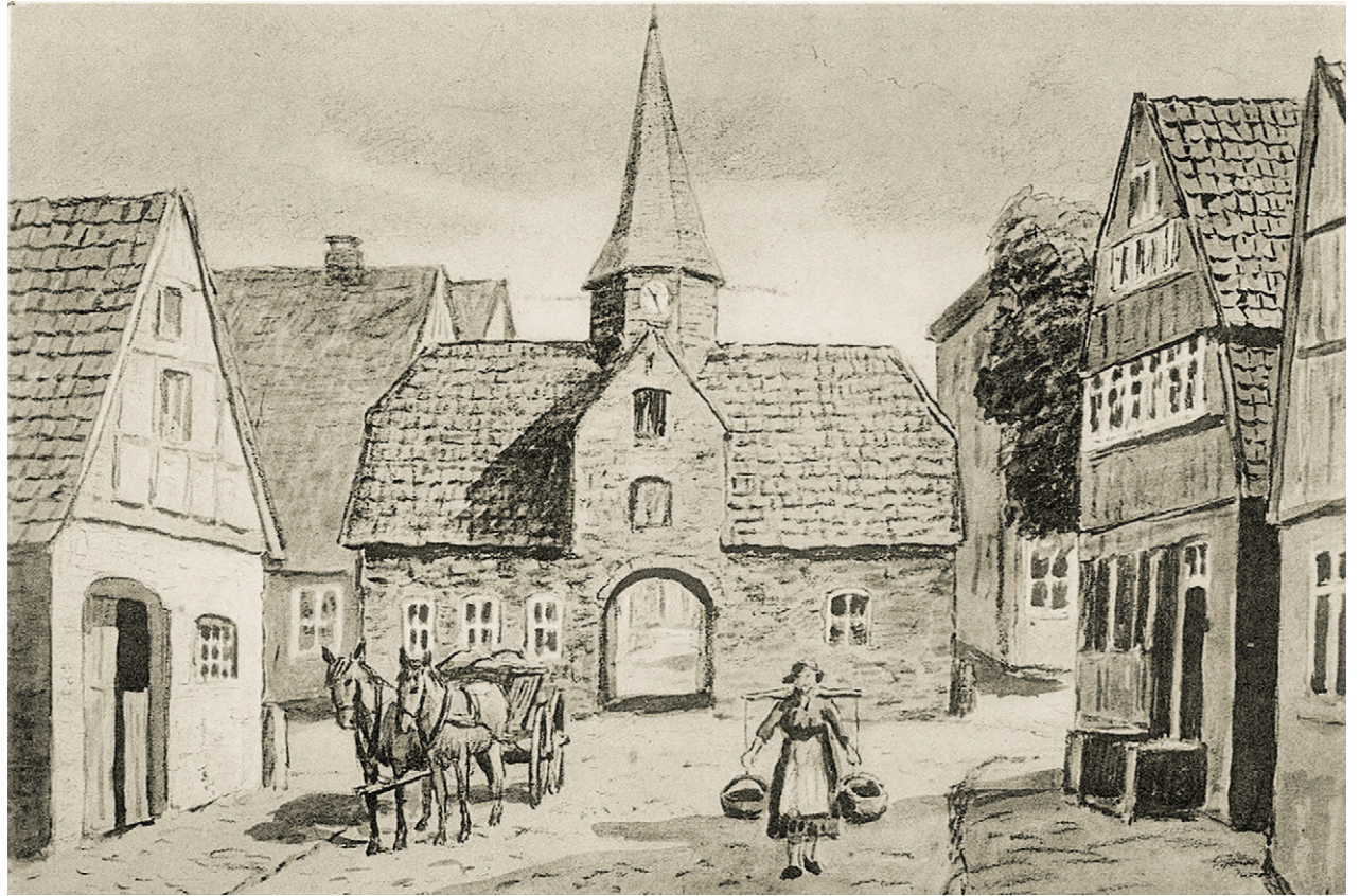
Das Ostertor in Otterndorf – im Bild in einer Zeichnung von Karl Otto Matthaei – war Dienstwohnung des jüngeren Nachtwächters

Für das doch umfangreiche Aufgabengebiet war die Entlohnung der Nachtwächter recht gering. Bei der Einstellung berücksichtigte man in der Regel in Ehren entlassene Sol-