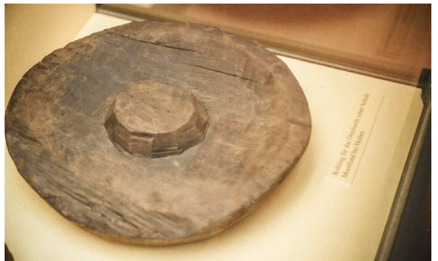
Schalenrohling aus Hollen in der Dauerausstellung im Museum Burg Bederkesa