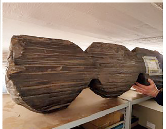
Der Fund 54 Jahre später im Magazin, in der Burg Bederkesa