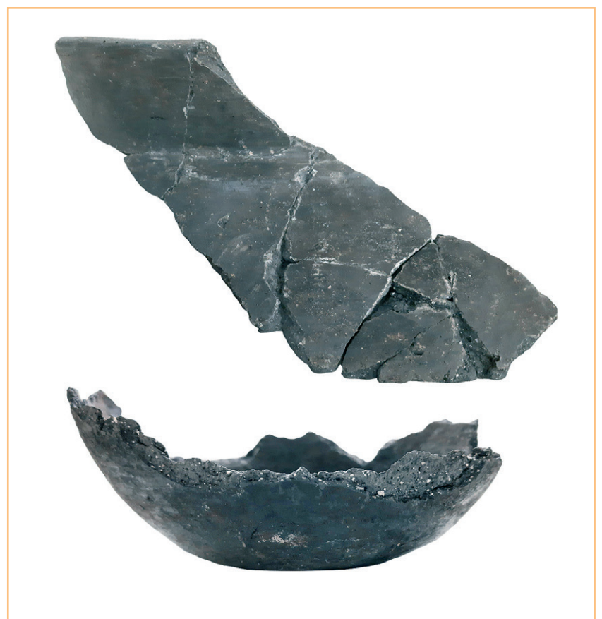
Fragmente von Gefäßkeramik aus dem Hollener Moor