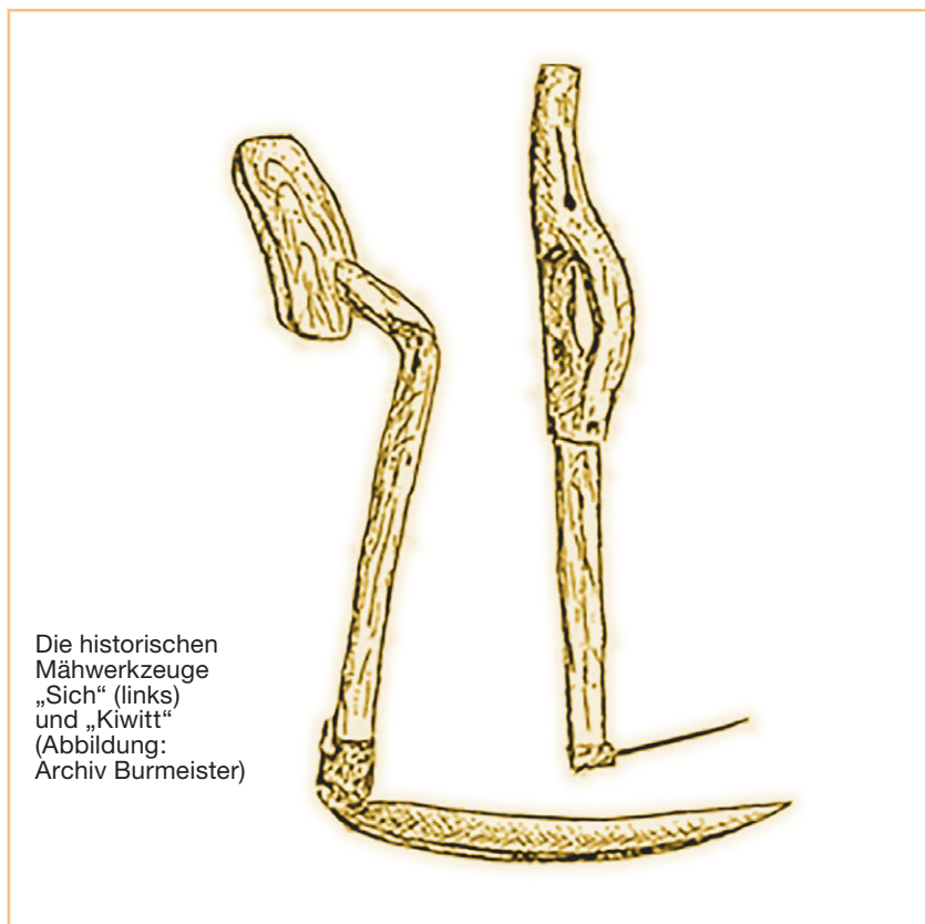
Die historischen Mähwerkzeuge „Sich“ (links) und „Kiwitt“