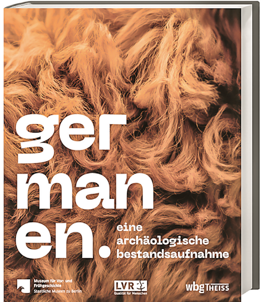
Cover des Ausstellungskatalogs zur Germanen-Ausstellung (Abbildung: Verlag WBG/Theiss)