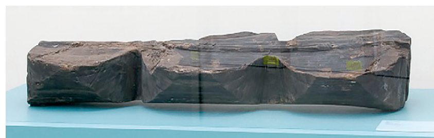
Der gesplattene Ahornstamm von 1,28 m Länge aus dem Hollener Moor in der Germanen“-Ausstellung in Berlin. Die Einkerbungen weisen ihn als Rohling für drei Holzschalen aus