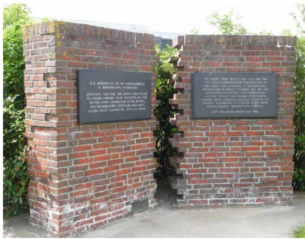
Gedenktafel für die ausländischen Fremdarbeiter im Zweiten Weltkrieg Am Baggerloch/Kühlhausstraße

Heute bestehen an das Lebensmittel Fisch weitaus größere Qualitätsanforderungen und der Frischfisch wird in der Regel nach sehr kurzen Fangreisen durch die Kutter und Trawler in Fangplatznähe angelandet. In einer geschlossenen Kühlkette wird der Fisch per LKW in den Fischereihafen Bremerhaven gebracht. Die deutsche Fischereiflotte besteht aktuell nur noch aus einigen wenigen Fahrzeugen, die überwie-