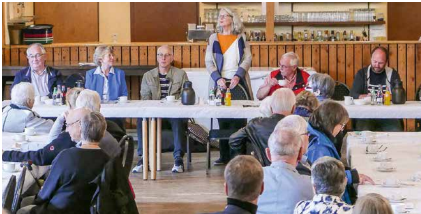
Die Vorsitzende im Kreis des Vorstands bei ihrem Rechenschaftsbericht über das Vereinsgeschehen