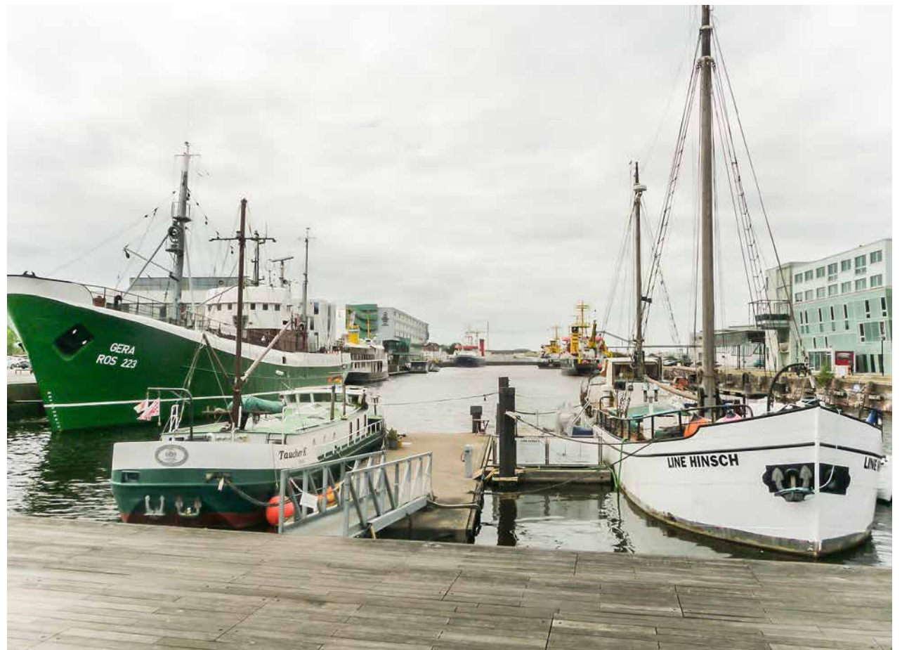
Hafenbecken des Fischereihafens I am „Schaufenster Fischereihafen“ im Jahr 2018