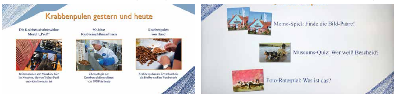
Informative und unterhaltsame Tafeln im Museum geben viel Wissenwertes weiter