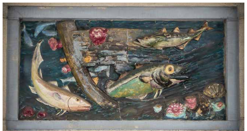
Beispiel für die Keramikreliefs des Worpsweder Künstlers Willi Ohler über den Eingängen der Halle XIV