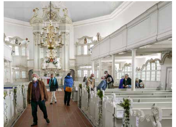
Zum Besichtigungsprogramm gehörte auch ein Besuch der St. Petri Kirche in Osten