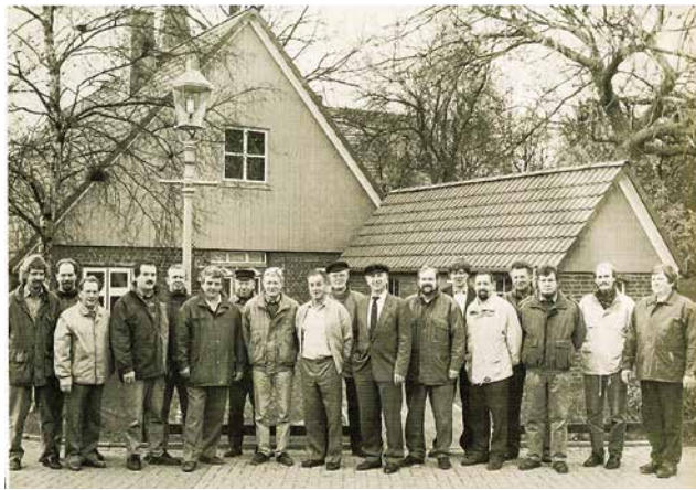
Aktive Mitglieder und der Vorstand des Wremer Heimatkreises 85 e.V., die zusammen mit den Handwerkern das Museum aufgebaut haben

Als 1988 in Wremens Ortsmitte ein altes Tagelöhnerhaus leer stand, ergab sich für unseren Verein eine einmalige Gelegenheit. Meinem Antrag, das Gebäude dem Heimatkreis zu übertragen, stimmte der Gemeinderat am 20. Dezember 1988 zu. Eine Planungsgruppe erarbeitete ein Museumskonzept, das bis heute gültig ist.