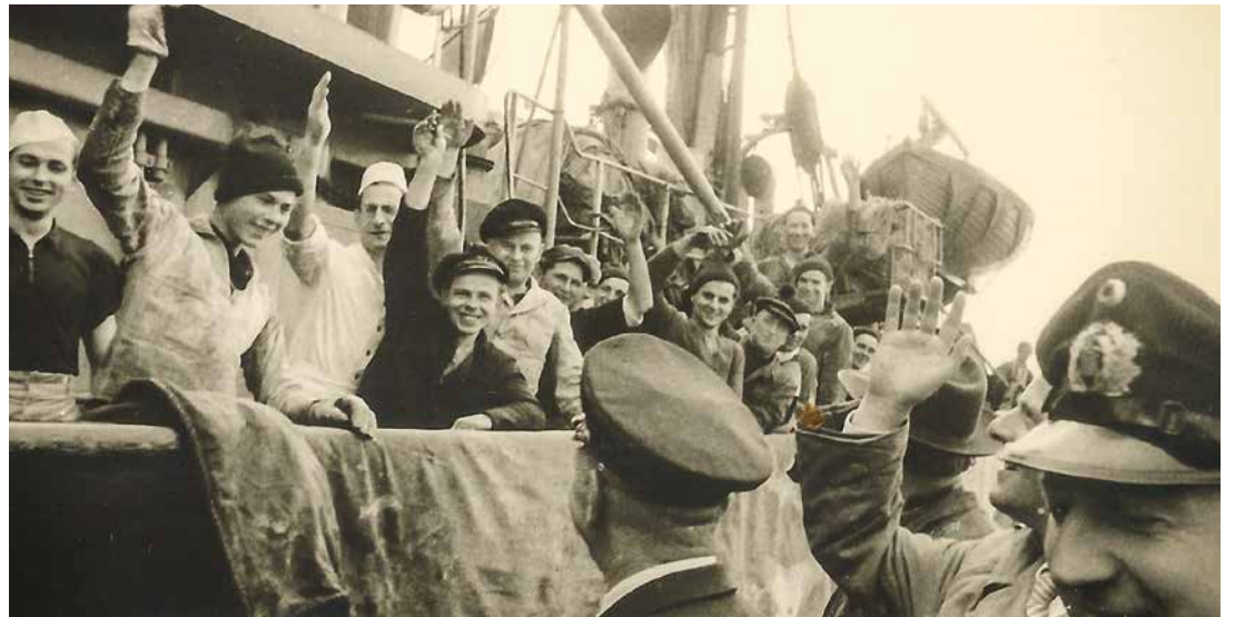
Die Besatzung des Fischdampfers CUXHAVEN beim Auslaufen am Freitag, dem 8. August 1952

Bei der Rückkehr erwartete eine städtische Delegation mit dem Cuxhavener Stadtamtmann Fredrebohm und dem Cuxhavener Ratsmitglied Biebert den Fischdampfer, um Besatzung und Kapitän für ihre Mitwirkung bei einer ungewöhnlichen Aktion zu danken. Stadtamtmann und Ratsherr überreichten einen Silberbecher und ein gerahmtes Foto, das am Tag des Auslaufens von dem