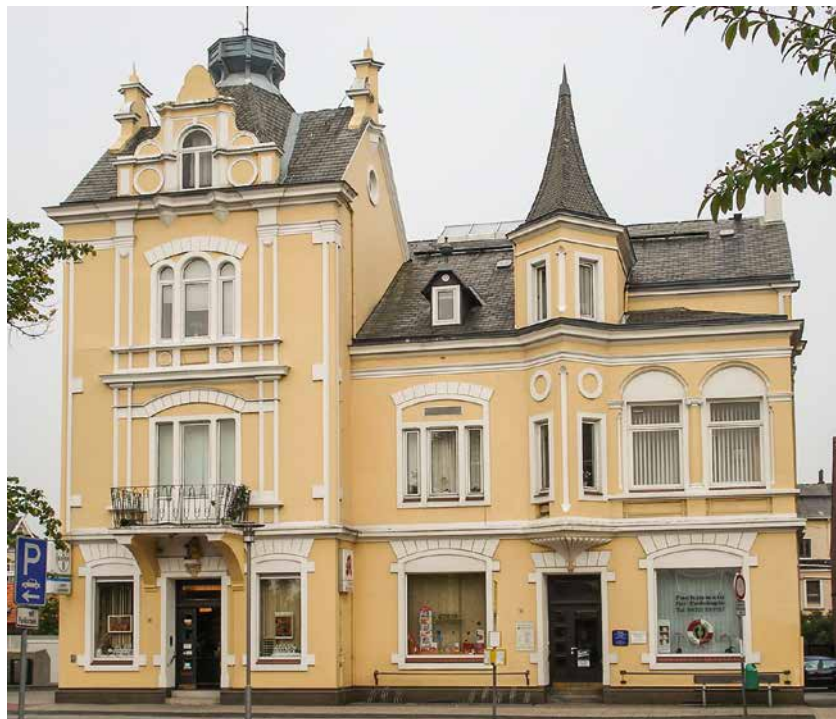
Die 1895 errichtete Löwenapotheke in der Deichstraße

Das Wappen des goldenen Löwen über dem Eingang der Apotheke entstand in der Mitte des 18. Jahrhunderts nach einem Entwurf von David Benjamin Opitz (1712-1756) aus dem Jahre 1747 und hat der Apotheke ihren Namen gegeben. Im Archiv des Amtes Ritzebüttel wurde schon vor Jahrzehnten eine Zeichnung des Bildhauers entdeckt, die einen nach links blickenden Löwen darstellt, der aufrecht auf einer Konsole sitzt und mit den vorderen Tatzen ein stehendes Hamburger Wappen hält. Die Konsole trägt die Inschrift: Privilegierte Apotheke Anno 1747 . Signiert ist