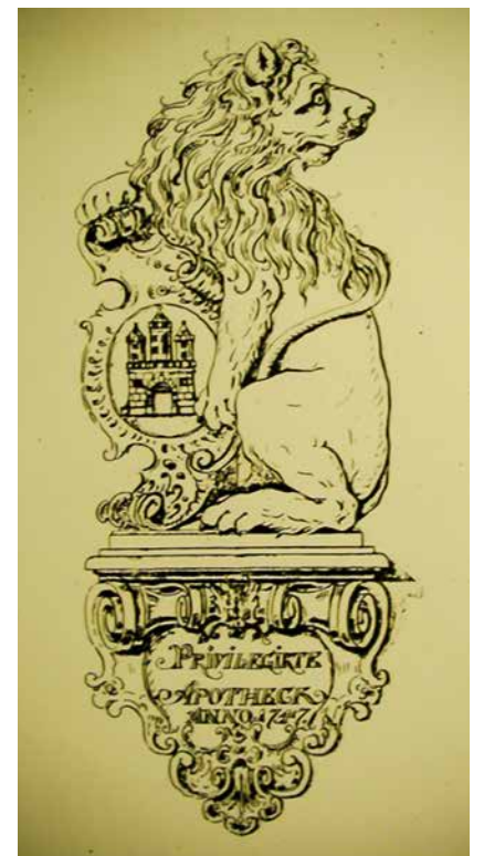
Entwurf der Löwen-Skulptur von David Benjamin Opitz