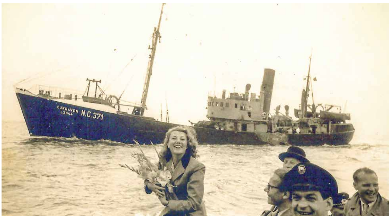
Die als 20000. Kurgast des Nordseeheilbades im Jahr 1952 geehrte Urlauberin aus Bonn an Bord des Bootes der Wasserschutzpolizei und der auslaufende Fischdampfer CUXHAVEN

Schubert, K.: Über den deutschen Heringsfang und die Heringsuntersuchungen im Jahre 1958. Hg. Institut für Seefischerei Hamburg. Hamburg 1958