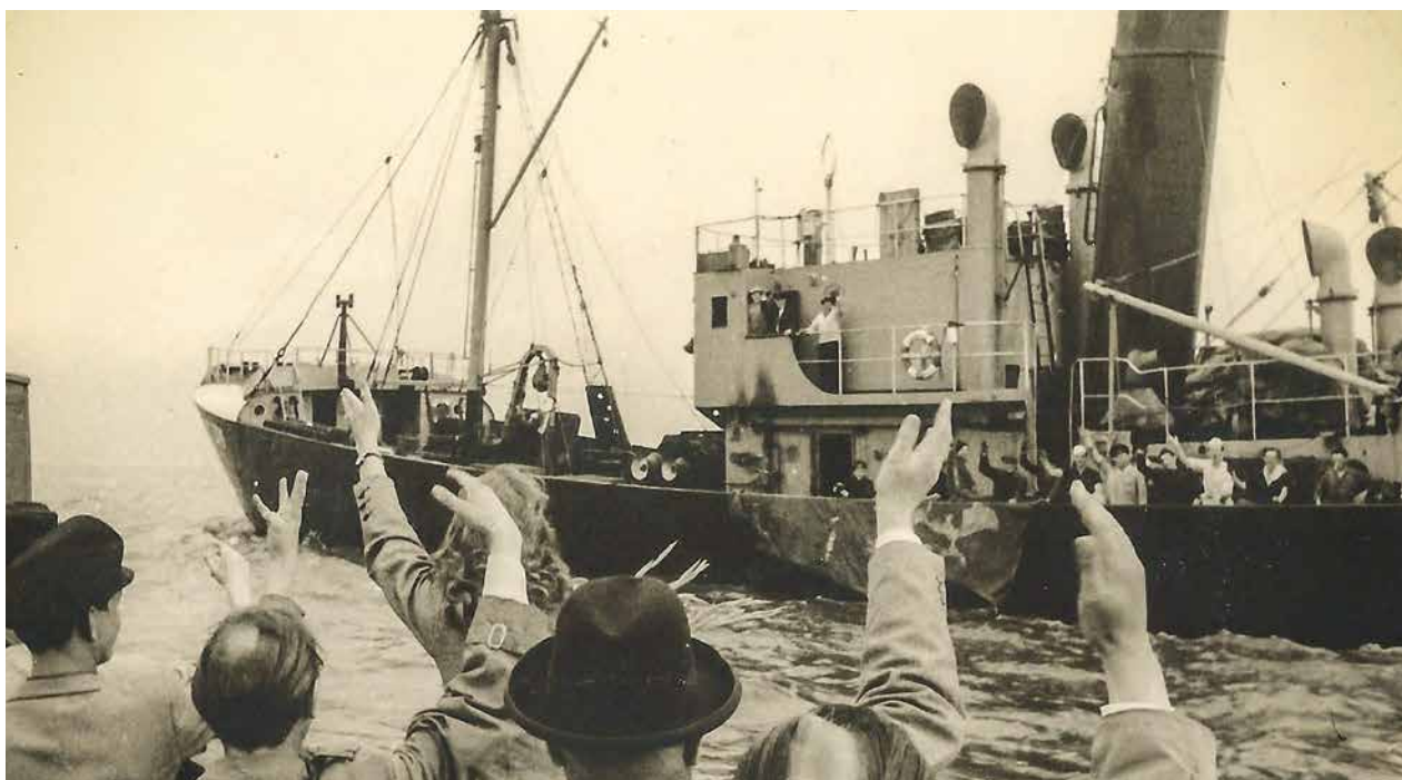
Zum Abschied winkt die geehrte Bonnerin der Besatzung der CUXHAVEN zu