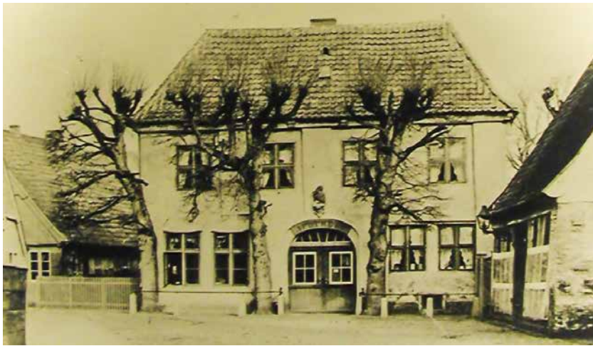
Die Apotheke in der Hardewiek