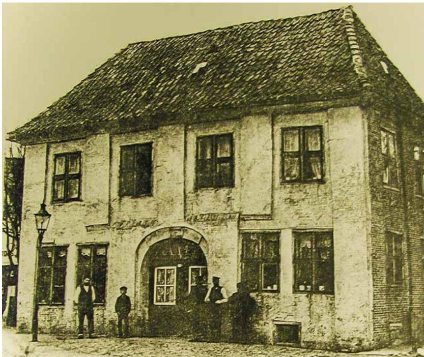
Die alte Apotheke in Ritzebüttel um 1886