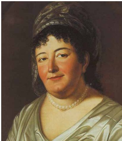
Pauline Fürstin zur Lippe. Porträt von Johann Christoph Rincklake aus dem Jahr 1801 im Lippischen Landesmuseum Detmold

Ihre Bemerkungen während des Badeaufenthalts machen deutlich, dass sie eine genaue Beobachterin der hiesigen Verhältnisse war. Aufschlussreich ist ihr Hinweis, dass mit der Gründung des Seebades die passab-