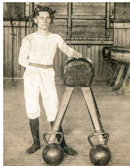
Aus der frühen Zeit der Leibesertüchtigung: Sportler mit Lorbeerkrantz und Sportgeräten im Jahr 1862

In mehreren Stationen von den Anfängen über die politische Instrumentalisierung ab 1933, den Wiederaufbau nach 1945 und die olympischen Impulse Anfang der 1970er Jahre zeichnet das Historische Museum die lokale Entwicklung des Sports von der Leibesertüchtigung bis zur Selbstoptimierung bis an die Gegenwart heran nach. Es erinnert mit Sportkleidung und -geräten, mit Plakaten und Fotografien, Urkunden und Trophäen an den Schul- und Breitensport, an Sportler*innen und Sportler, an Erfolge und Niederlagen sowie an Begeisterung und Ehrenamt. Dabei ist der Sport in Bremerhaven so vielfältig und facettenreich, dass sich die Ausstellung auf zentrale Aspekte fokussiert. Bremerhaven war und ist eben eine Stadt in Bewegung.