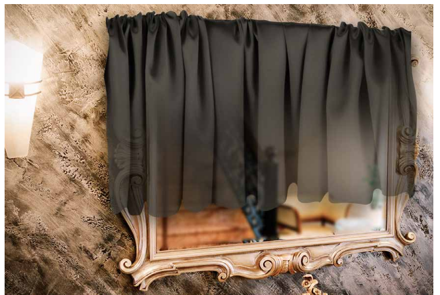
Ein verhängter Spiegel war noch in der Mitte des 20. Jahrhunderts während der Aufbahrung von Gestorbenen im Haus weit verbreitet

Man soll die Zahl der warzen am Körper feststellen und in einen Zwirnsfaden ebensoviele Knoten, wie man Warzen hat, knüpfen. Den verknoteten Zwirns-