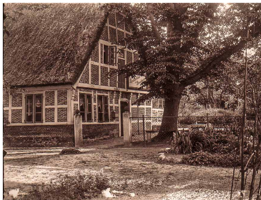
Bei ihrem Aufenthalt machte Fürstin Pauline zur Lippe einen Ausflug zum reetgedeckten Schleusengasthof in Otterndorf