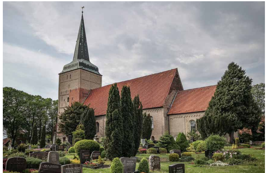
Die Kirche in Wremen inmitten des Dorffriedhofs. Der Trauerzug bei einer Beerdigung führte mit dem Sarg eines Verstorbenen vom Haus, wo er aufgebahrt wurde, zum örtlichen Friedhof

Überall auf den Friedhöfen im Lande Wursten stößt man auf die merkwürdige Sitte, daß bei einer Beerdigung der Sarg ein- oder dreimal um die Kirche, die hier immer inmitten des Friedhofs steht, herumgetragen wird. Dafür gibt es mehrere