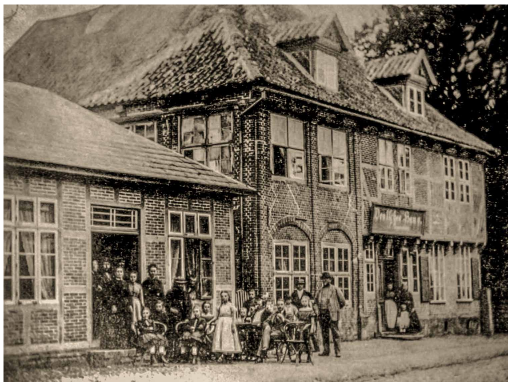
Im Gasthof „König von England“, der ab 1826 unter dem Namen „Deutsches Haus“ geführt wurde, nahm die Pauline Fürstin zur Lippe bei ihrem Kuraufenthalt das Abendessen ein

Ziel der mit Abstand weitesten Partie war das benachbarte, von Ritzebüttel etwa zwei Stunden entfernte Otterndorf. Dort hielt sie sich in der Nähe der Schleuse auf, wo sich dreimal wöchentlich in einem schön angelegten Garten zahlreiche Gäste zum Reden, Arbeiten, Kegeln oder Tanzen trafen. Während der Kutschfahrt stießen ihr vor allem die Besonderheiten