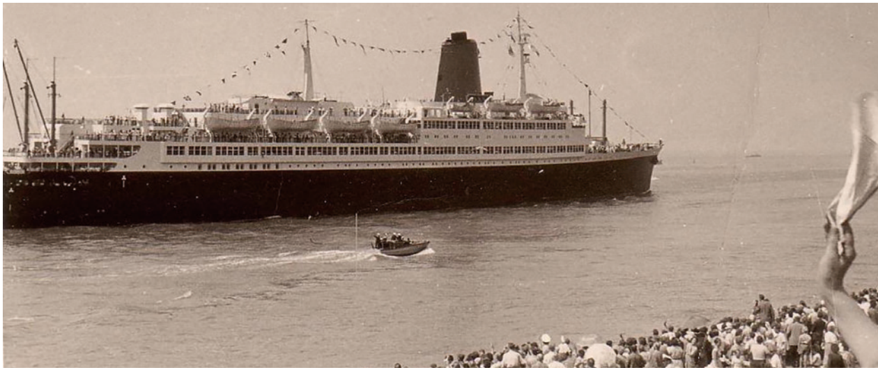
Über die Toppen geflaggt und mit allen Passagieren an Deck beginnt die BREMEN am 9. Juli 1959 mittags in Bremerhaven ihre Jungferreise nach New York, während ihr die Zurückbleibenden auf der Columbuskaje nachwinken

Erinnerungen an die Jungferreise der BREMEN des Norddeutschen Lloyd im Juli 1959