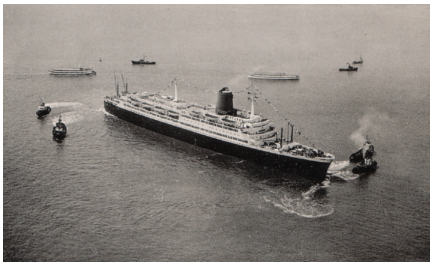
Vier Schlepper drehen die BREMEN vor der Columbuskaje in Richtung Außenweser. Im Hintergrund die Schreiber-Dampfer DEUTSCHLAND und OCEANA

Am Abend gehört Ado Schiff zu den wenigen prominenten Gästen einer Cocktailparty in der Kapitänswohnung gleich hinter der Brücke. Hein-