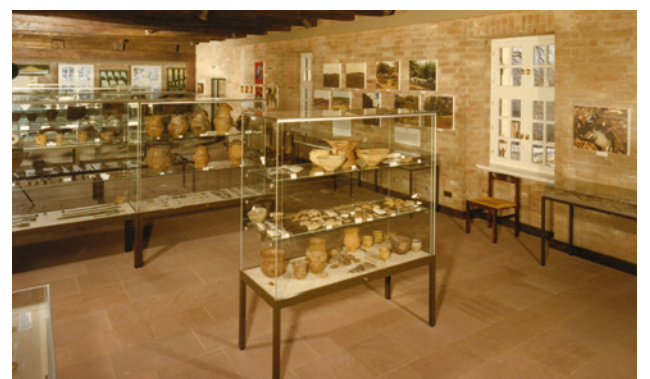
Impression aus der ursprünglichen Dauerausstellung