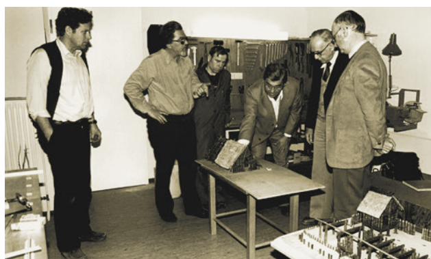
In der Werkstatt des Museums werden aufgrund der Grabungsergebnisse Hausmodelle gebaut