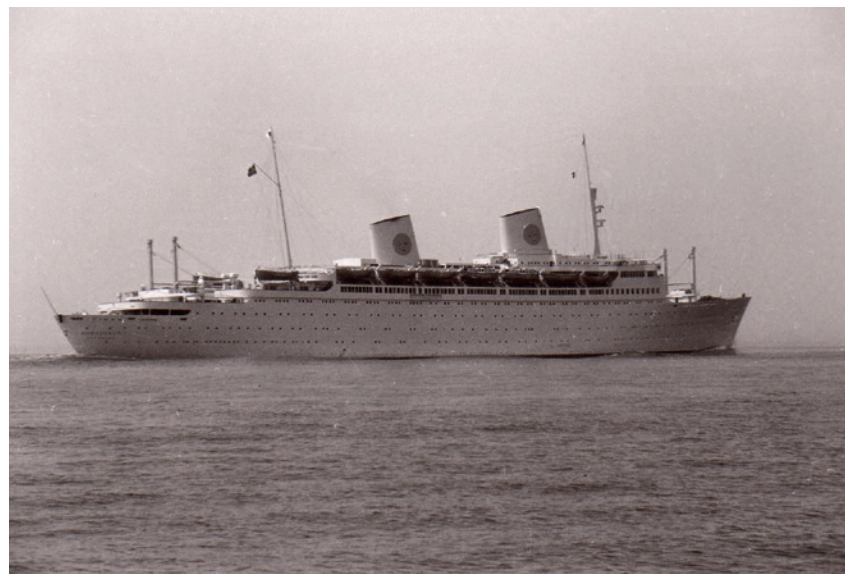
Die KUNGS HOLM hat die Columbuskaje verlassen und ist auf dem Weg nach Göteborg