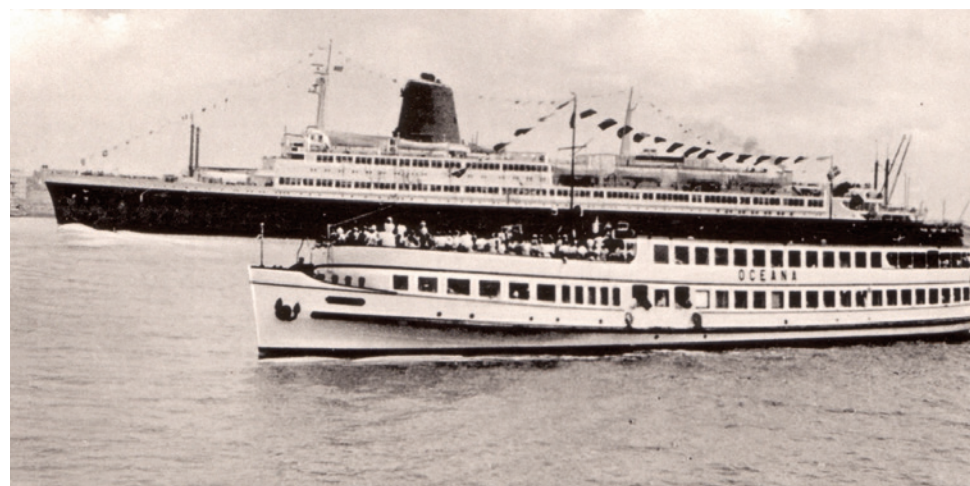
Die OCEANA begleitet die BREMEN bis in die Außenweser