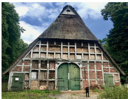
Der Hof in Lamstedt