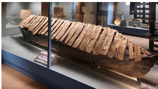
Das bekannte Bootsgrab vom Gräberfeld an der Fallward in der heutigen Ausstellung

Die museale Präsentation hat seit einem Ausstellungsumbau im Jahr 1997 diese drei bedeutsamen Forschungsvorhaben Feddersen Wierde, Fallward und Siedlungskammer Flögeln in der