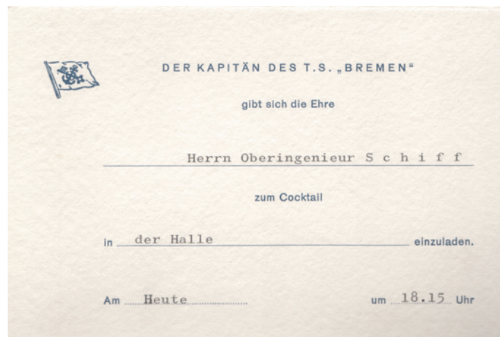
(Abb.: Schreiber) Einladung zum Cocktail-Empfang beim Kapitän (Abb.: Archiv DSM)