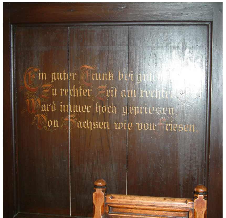
Wandpaneele im ehemaligen Thekenbereich des Friesenzimmers in Schloß Morgenstern