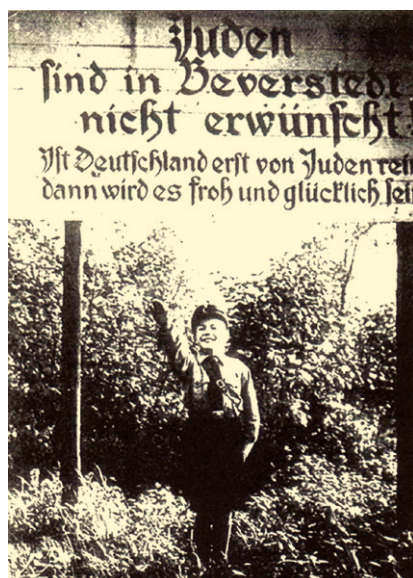
Plakat am Ortseingang