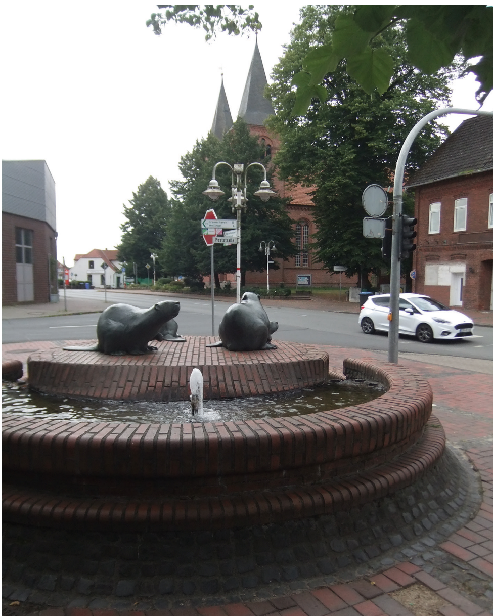
Der Biberbrunnen in Beverstedt (heute) war der Sammelpunkt für die Juden zur Deportation

Für diejenigen Beverstedter, die gegen Ende des Krieges Ju- gendlich oder Kinder waren, ver- mischten sich die grauenvollen Ereignisse der NS-Zeit bzw. der Zeit des Kriegsendes. Dafür mag die Zeitzeugin Käthe W., geb. 1928, stehen. Sie erinnert sich an drei Ereignisse in Beverstedt-Taben in den Jahren 1940/41: Als junges Mädchen mußte ich an- stelle meiner älteren Schwestern einen Korb mit Lebensmitteln (Eier, Butter, Brot, Kartoffeln) in der Dun- kelheit an einem vereinbarten Treff- punkt (Wir hatten schon Telefon) in der Beverstedter Feldmark, zwischen