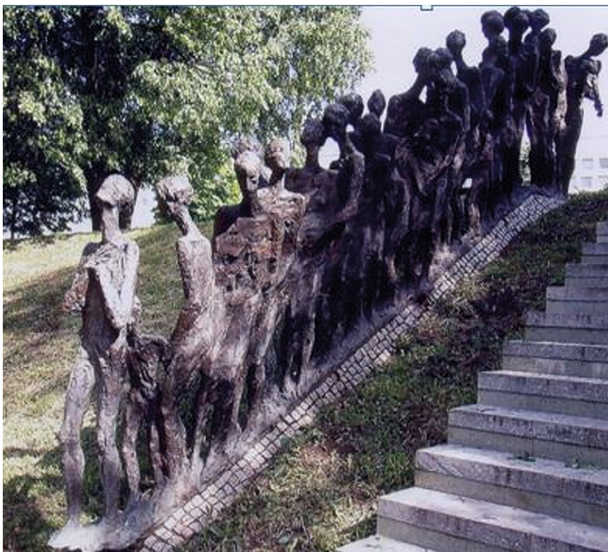
Denkmal beim Ghetto in Minsk für die ermordeten Juden

Das Schicksal der Beverstedter Juden der Familie Brumsack hat die Jugendliche tief beeindruckt. Wei-