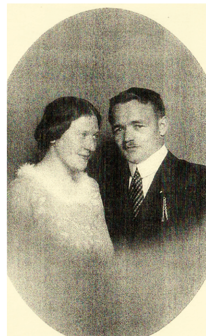
Das Ehepaar Moll

Eine neutralere Zeitzeugin berichtet: Einmal in der Woche versammelten sich der „Jungmädelsbund“ (JM), 10 – 14 Jahre alt oder der „Bund Deutscher Mädels“ (BDM), 14 – 18 Jahre alt, auf Beverstedts Marktplatz in der Ortsmitte. Es war Pflicht, daran teilzunehmen. Aufgestellt in 3er – Reihen, marschierten wir zum HJ – Heim am Adelstedter