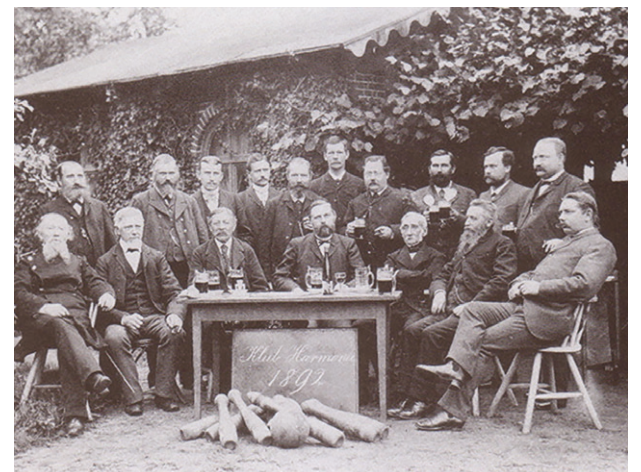
Honoratioren des Clubs Harmonie in Beverstedt