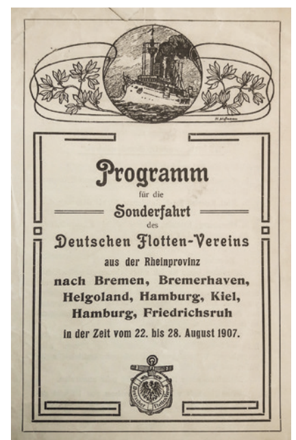
Die Sonderfahrten des Flottenvereins erfreuten sich mit ihrem umfassenden Programm großer Beliebtheit