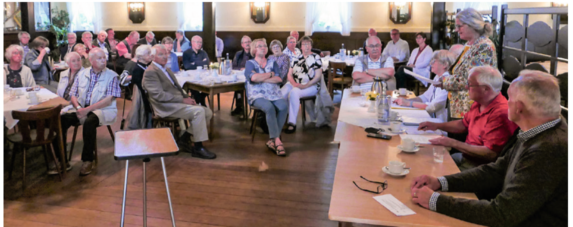
Die Zuhörerschaft verfolgt auf der Mitgliederversammlung aufmerksam den Bericht der Vorsitzenden