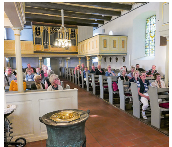
Die Morgensterner folgten den Ausführungen zur Geschichte der Kirchwistedter Kirche mit großem Interesse