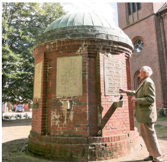
Das Kriegerdenkmal für die Gefallenen der beiden Weltkriege vor der Beverstedter Kirche