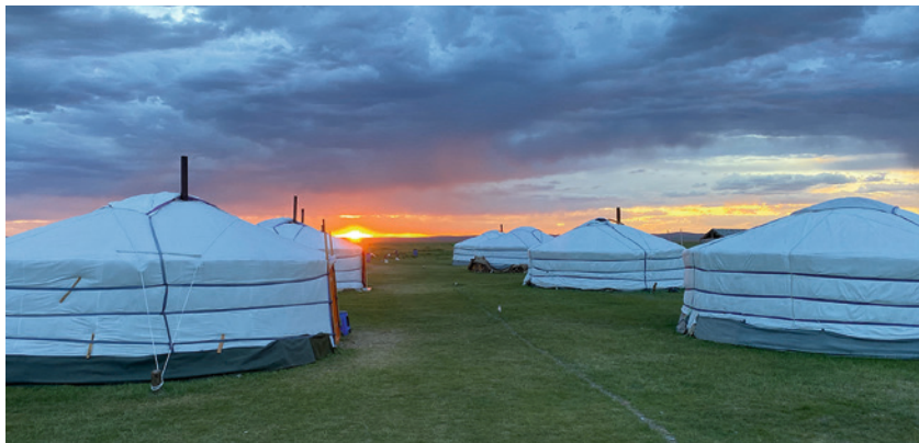
Grabungsdorf auf der Ausgrabung des DAI in der Mongolei