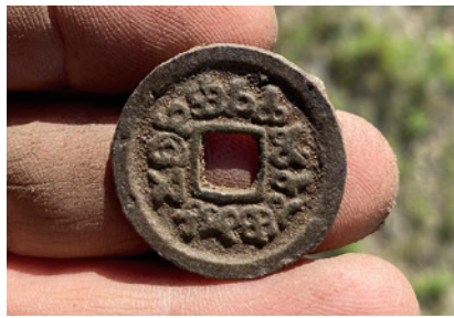
Fundstück der Ausgrabung im Orchontal in der Mongolei

Auf der riesigen, in der Neuzeit un bebauten Fläche spielen für die Anlage von Suchschnitten die Aufnahme des Geländes aus der Luft und die Erstellung eines Rasters sowie das Aufspüren von Bebauungsresten per Laserscanner eine Rolle. Eine weitere Erkundung des Geländes findet per Sondengang statt.