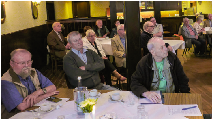
Man machte sich sogar Notizen zu den erfreulichen Berichten der Vorsitzenden und des Kassenführers. Auf dieser Basis konnte die Entlastung des Vorstands erfolgen