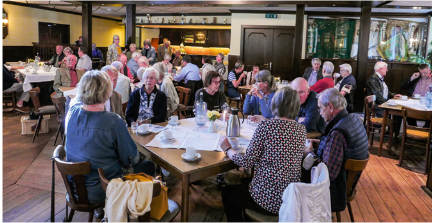
Während sich einige Mitglieder der „Männer vom Morgenstern“ Kirchwistedt noch anmelden, warten andere schon auf die Eröffnung der Mitgliederversammlung