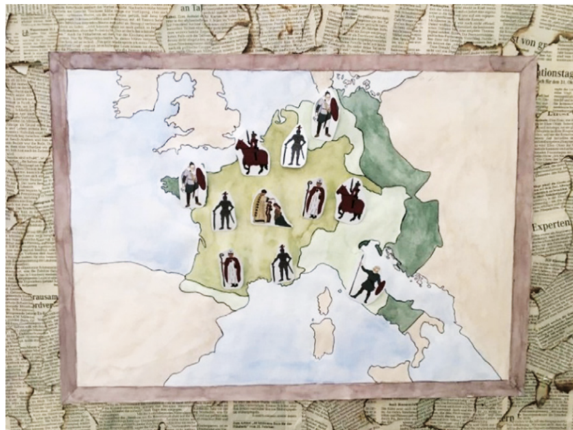
Künstlerische Arbeit als Grundlage für die Darstellung zur Geschichte der Burg in Hagen als „Graphic novel“

Am Tag des offenen Denkmals im September 2022 probierten zahlreiche Besucher unter Führung des Kultur- und Heimatvereins „Burg zu Hagen im Bremischen“ dieses tolle Angebot mit den in der Burg ausleihenden Tablets oder dem eigenen Handy aus. Jutta Siegmeyer