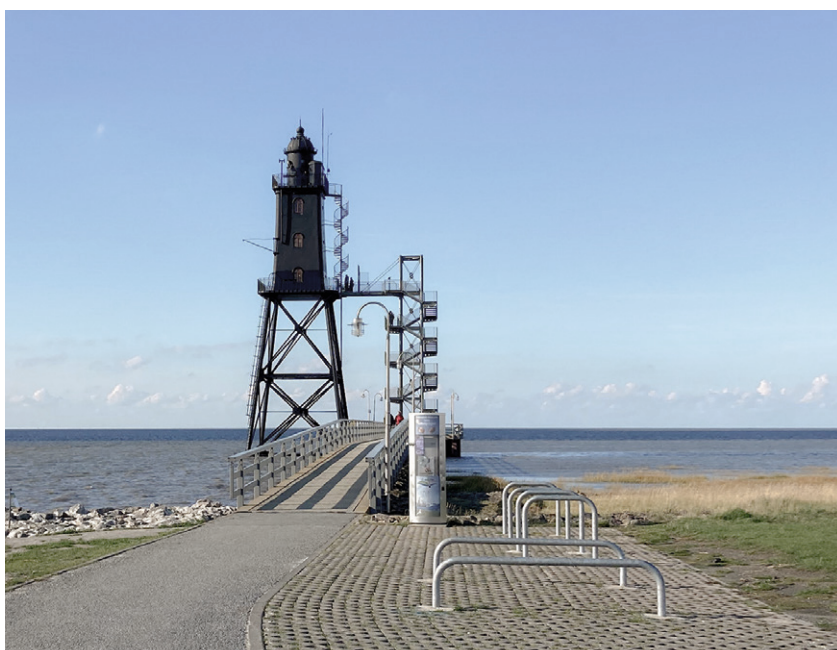
Der Leuchtturm Obereversand war erster Anlaufpunkt der Exkursion der BHU-Tagung 2022