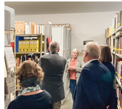
Tagungsteilnehmer informieren sich über die regionale Bedeutung der Bibliothek für die Forschungsarbeit