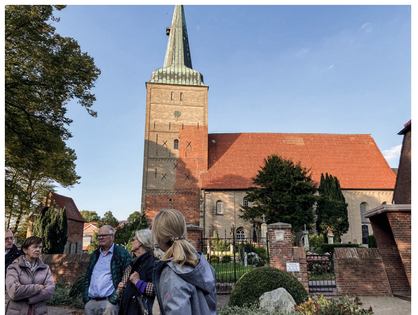
Ziel der Exkursion ins Land Wursten war auch die Kirche in Wremen