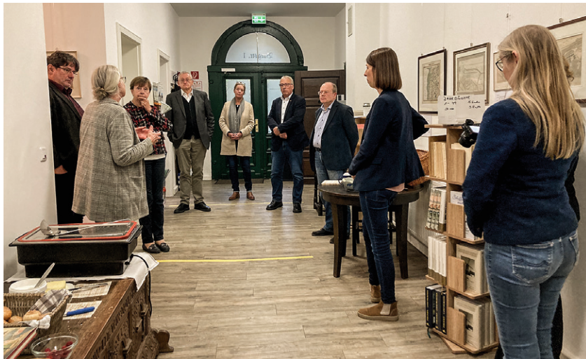
Schloß Morgenstern, Gründungsort und Sitz des Vereins der Männer vom Morgenstern