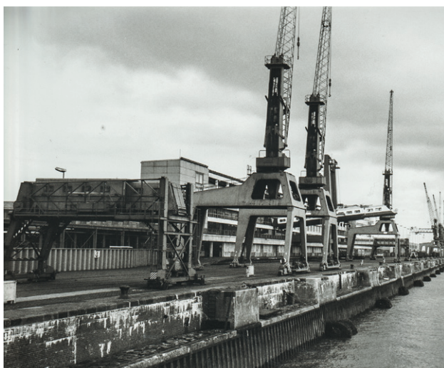
Columbuskaje und Fahrgastanlage II, 1985