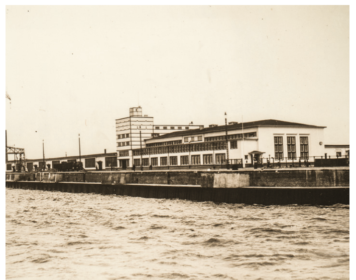
Columbuskaje und Columbusbahnhof, um 1928