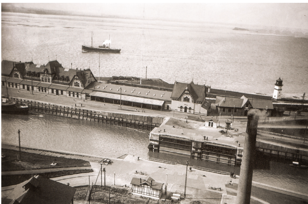
Lloyd-Wartehalle am Vorhafen der Großen Kaiserschleuse, um 1910