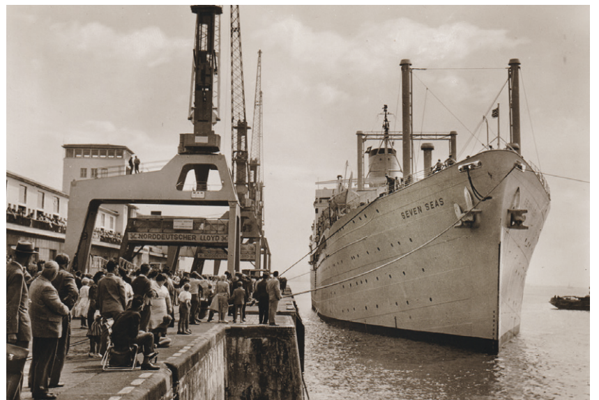
Die SEVEN SEAS vor der Columbuskaje mit der Fahrgastanlage I, um 1960

Von der nördlichen Columbuskaje fand von 1966 bis 1982 der Fährverkehr nach Harwich in England statt. Seit den 1960er Jahren wurde von hier bis um 1990 der Seebäder-