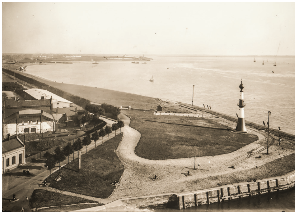
Lloyd-Wartehalle von 1869/70 (Bildmitte links) mit dem Minarett-Leuchtturm von 1893 (das heutige Unterfeuer Bremerhaven), um 1900

Im Mittelpunkt der Passagierabfertigung stand die neue Lloyd-Wartehalle von 1896, die sich entlang der westlichen Vorhafenkaje erstreckte und sich im Gegensatz zur ersten Wartehalle am Neuen Hafen außerhalb der Deichlinie befand. Sie besaß mehrere Wartesäle, eine Zollabfertigungs- und Gepäckhalle, eine Telegrafestation und Wirtschaftsräume. Später erhielt sie einen überdachten, höher gelegten Bahnsteig mit doppelter Schienenführung. Architekt war der Geestemünder Bauunternehmer Bernhard Scheller.