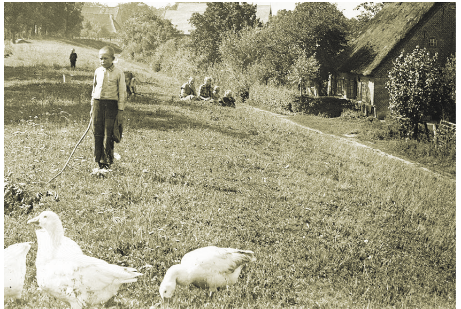
Hüten der Gänse auf dem Alten Deich in Wremen um 1900