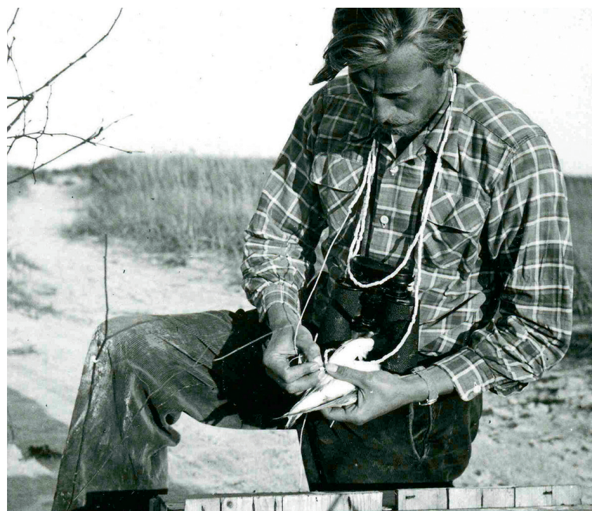
Ein Vogelwart bringt einen Seevogel