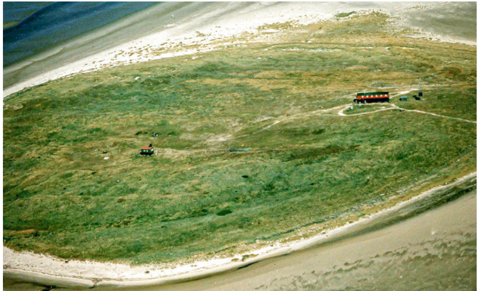
Ansichtskarte der Vogelschutzinsel Scharhörn mit dem „Hamburger Haus“ (rechts) und der bis 1983 existierenden Vogelwärterhütte (links)

Ein Artikel der Cuxhavener Zeitung am 9. Juni 1951 hatte die Überschrift Der Seeschwalbe gehört die ganze Liebe und der Schutz des Vogelwartes.