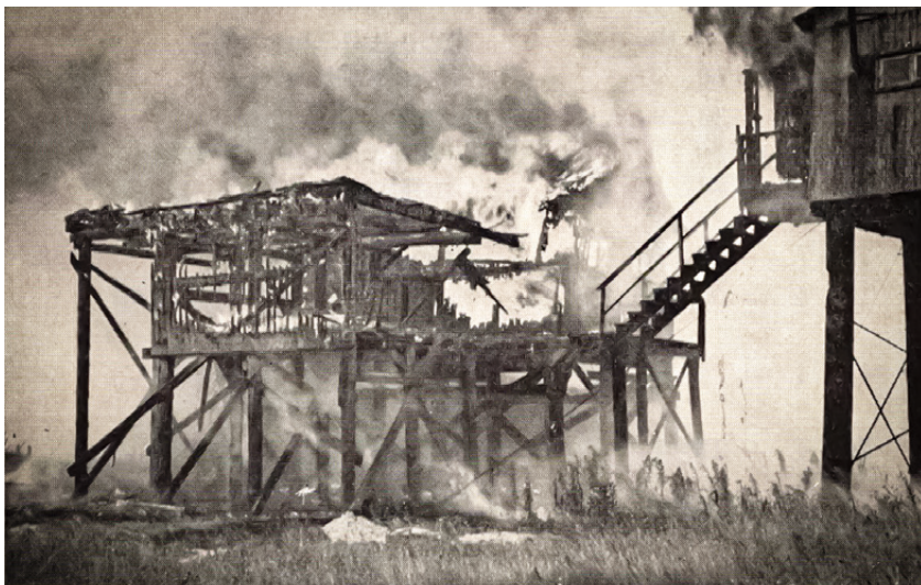
Der Brand der „Senatorenbude“ im Jahr 1953 (Abb. aus Manfred Temme, Vogelfreistätte Scharhörn, Hamburg 1967, S. 17)