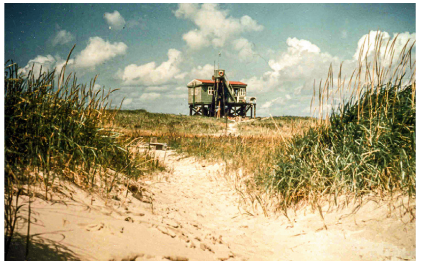
Die von 1957 bis 1983 auf Scharhörn bestehende Vogelwärterhütte