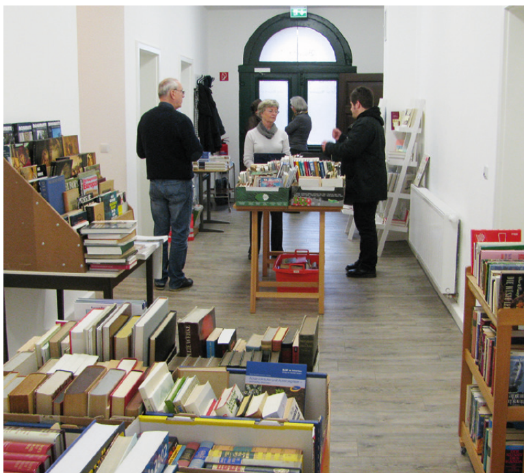
Bücherfest vor der Corona-Pandemie