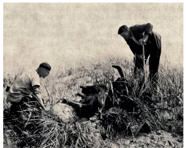
Ein Rattenbau wird von zwei Hunden ausgegraben