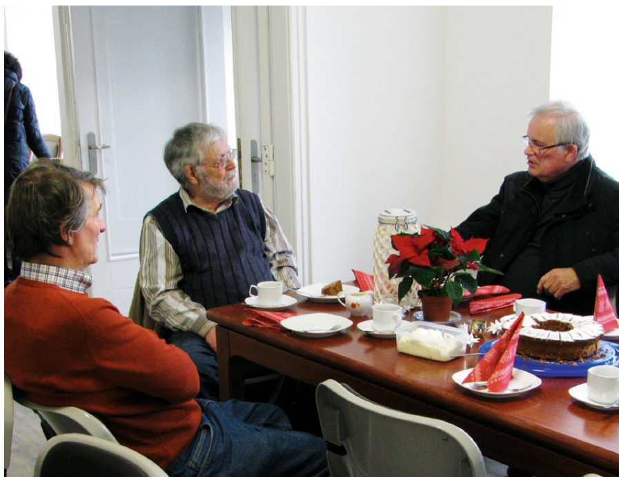
Bücherfestgäste im angeregten Gespräch