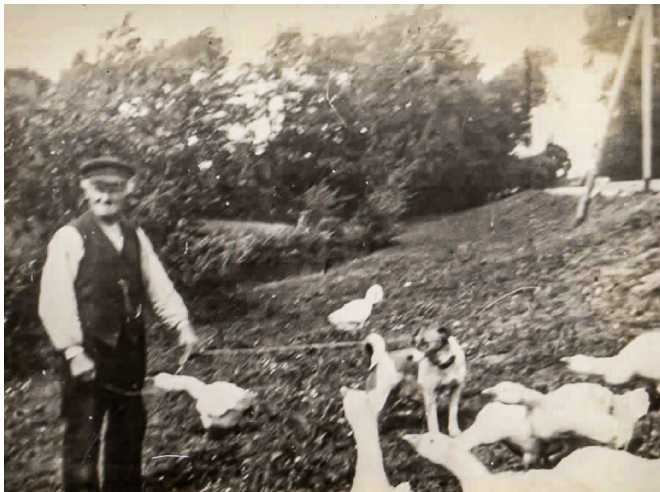
Gänsehüten um 1900