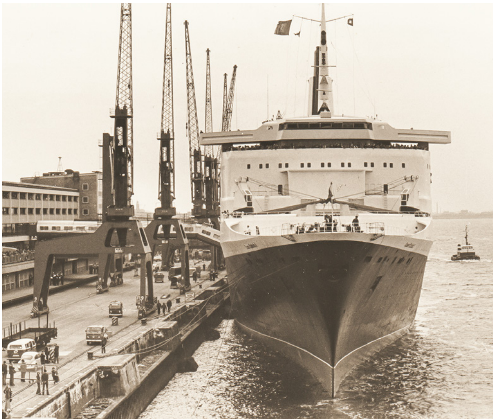
QUEEN ELIZABETH 2 an der Columbuskaje, 1975

Seit 1968/69 gab es bis 2000 Theaterbälle, den Ball Maritim, den Ball des Sports und Faschingsveranstaltungen von Sportvereinen. Auch tagte hier das traditionelle Hafenkonzert von Radio Bremen von 1977 bis 1993.