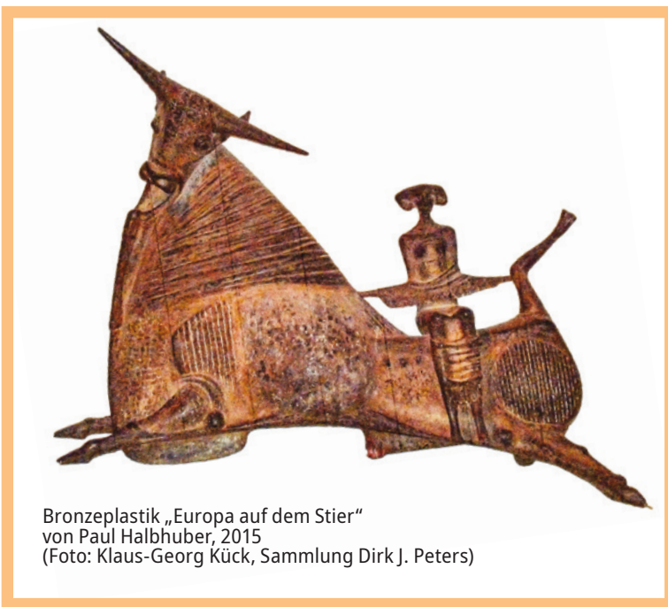
Bronzeplastik „Europa auf dem Stier“ von Paul Halbhuber, 2015