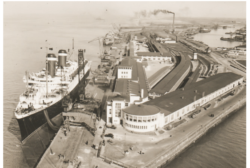
AMERICA am Columbusbahnhof I, 1950er Jahre

Entgegen dem Trend zu diesen riesigen Passagierterminals neigte sich die regelmäßige Passagierschiffahrt über den Nordatlantik von Bremerhaven nach New York seit den 1960er Jahren dem Ende zu. Das Flugzeug hatte den Ozeanlinern längst den Rang abgelassen und war für den Transport der Passagiere und Auswanderer schneller und preiswerter. Die UNITED STATES, das damalige schnellste und modernste Passa-