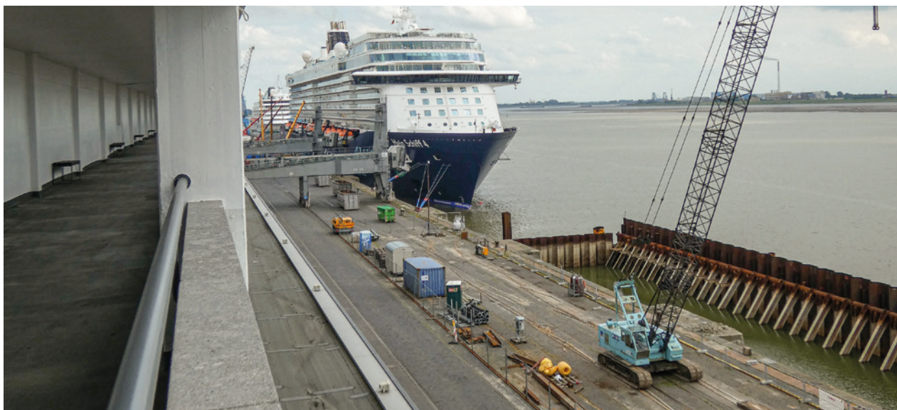
MEIN SCHIFF 4 an der Columbuskaje, Bau der neuen Kaje (rechts) und Zuschauergalerie (links) 2022