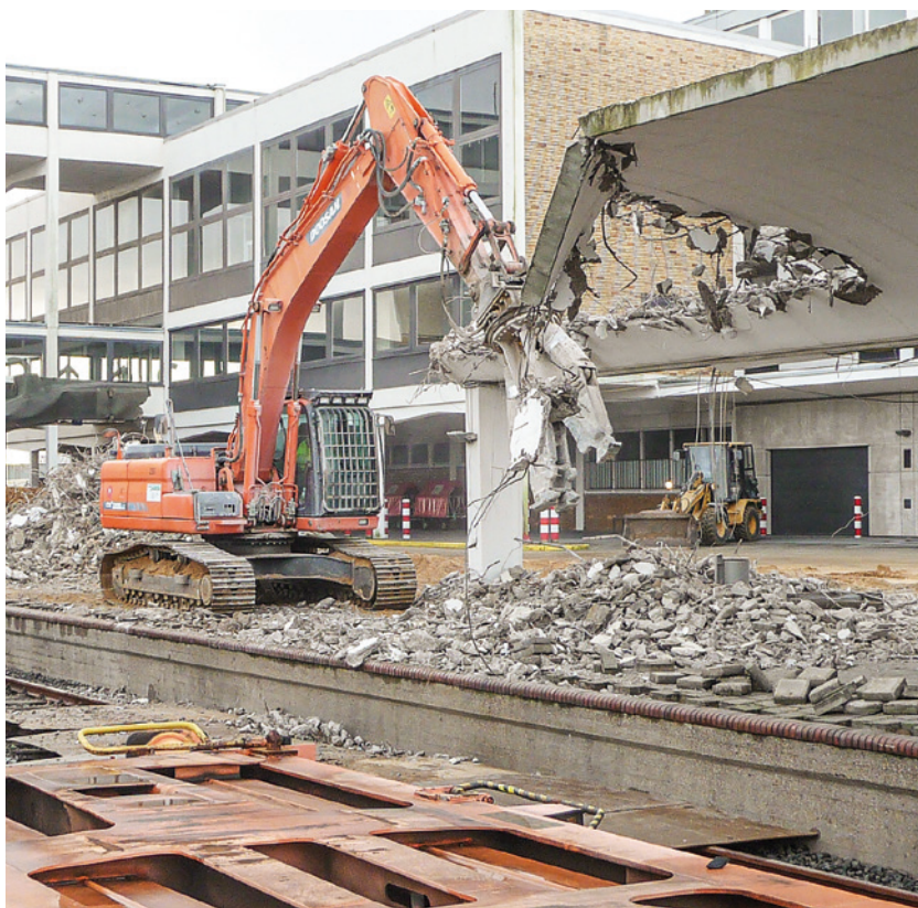
Abriss der Bahnsteige und Schienen, 2019

Auch hat es im CCCB Buchvorstellungen, Tagungen und diverse Veranstaltungen gegeben, die jedoch ähnlich wie in der historischen Fahrgastanlage II keine bleibende Wirkung hinterlassen haben. Insofern wäre es wichtig, diese interessante „Location“ des historischen Columbusbahnhofs II in Verbindung mit dem modernen CCCB direkt am Weserstrom in Bremerhaven für attraktive Veranstaltungen (Kino, Theater, Konzerte, Ausstellungen) intensiver zu nutzen.