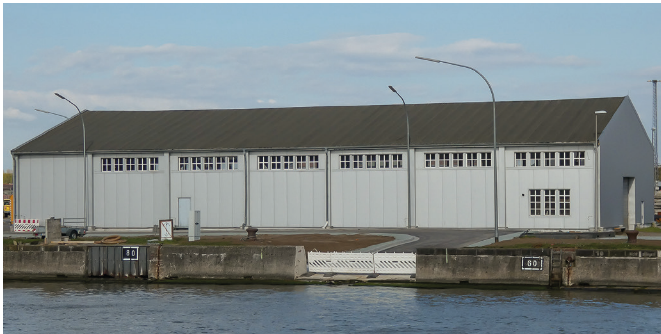
Teile der ehemaligen Holzhalle am Bauhof Brinkamahof, 2022

Seit den 1990er Jahren hatte es auch immer wieder Initiativen für den Erhalt der Fahrgastanlage II gegeben. Besichtigungen, Tage der offenen Tür und Veranstaltungen verschiedener Gruppen hatten aber keinen Erfolg.