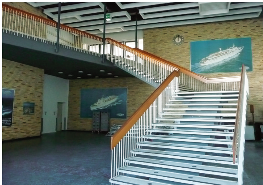
Treppenaufgang im Bürogebäude der Fahrgastanlage II, 2014