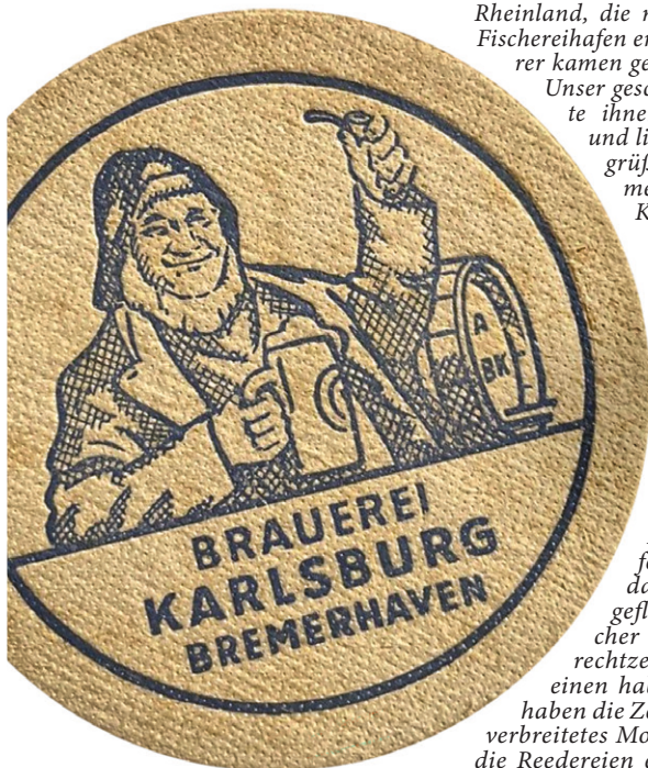
Ein alter Bierdeckel der Karlsburg-Brauerei: Das Bier mit dem sympathisch grüßenden Seemann auf der alten Pappe kam auch im Rosengarten aus dem Zapfhahn

Vier Besatzungsmitglieder des Trawlers „Rotesand“ wollten an einem Sonntag im September 1965 nach ihrem ausgedehnten Land-