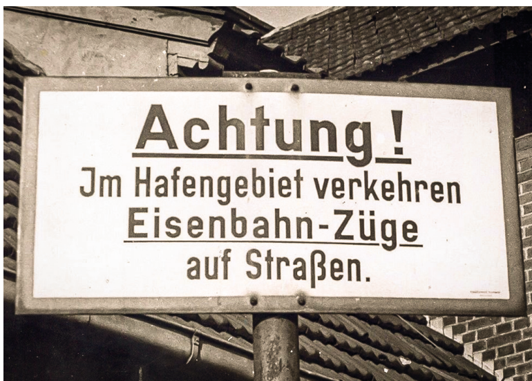
Gefährliches Pflaster im Fischereihafen durch Eisenbahn-Züge