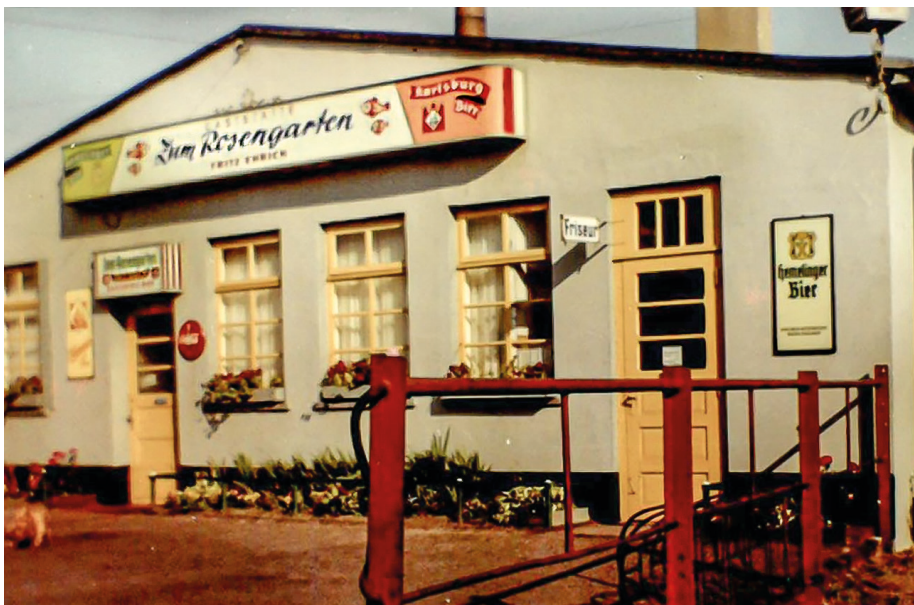
Die Vorderfront der Gaststätte: Zum Rosengarten mit Eingangstür zum Friseur

Unser Vater hatte für vieles Verständnis. Bestand jedoch die Gefahr, dass die neue Einrichtung der Gaststätte Schaden nehmen könnte, war seine Devise: Wehret den Anfängen. Wir haben ihn immer dafür bewundert, wie er sich durchzusetzen wusste. Wie er mit seinen Drohgebärden, etwa dem Hochheben seines Holzknüppels, viele Situationen merklich beruhigte. So wurden die Polizeibeamten vom Revier Geestemünde nur sehr selten dienstlich gebraucht. Zum kurzen Klön-schnack kamen die aber trotzdem vorbei.