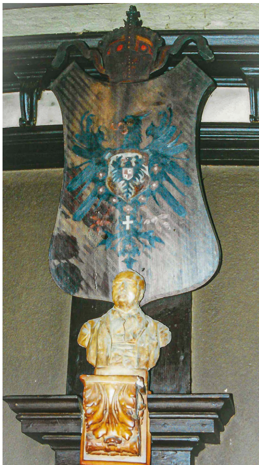
Die Büste von Herrmann Allmers vor dem Wappen im Friesenzimmer.

Das Bibliotheksteam und der Vorstand der Morgensterner freuen sich auf viel Besuch.