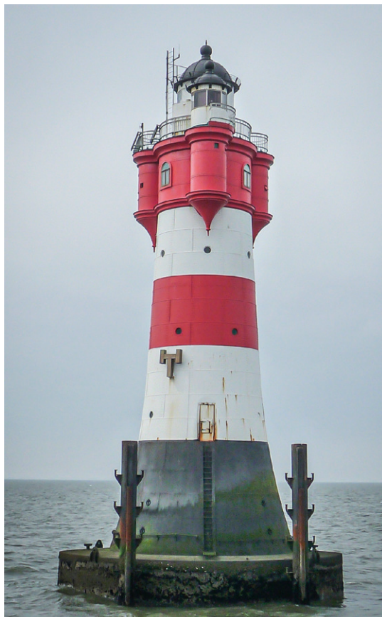
Der Leuchtturm Roter Sand im Jahr 2014