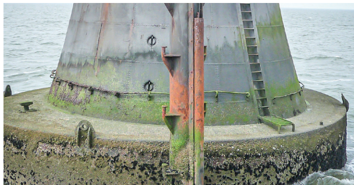
Der Turmsockel im Jahr 2014 (Foto: Dirk J. Peters)

Erinnerungstafel Leuchtturm Roter Sand als Wahrzeichen der Ingenieurbaukunst in Deutschland, 2010) im Dienstraum im Jahr 2014 (Foto: Dirk J. Peters)