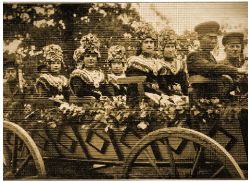
Präsentation von Brauttrachten beim Trachtenfest von 1904