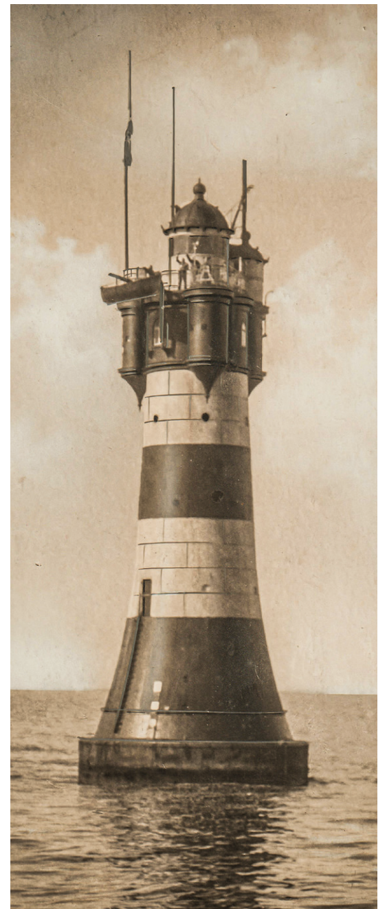
Roter Sand Leuchtturm vor der Wesermündung in den 1930er Jahre.