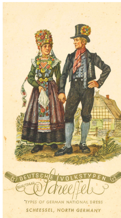
Menükarte von Bord eines Dampfers des Norddeutschen Lloyd, 1939. Die Scheeßeler Tracht wurde hier als Inbegriff eines „Volkstyps“ verstanden