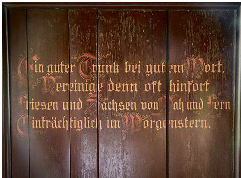
Im Friesenzimmer des Schlosses Morgenstern: Der Trinkspruch am Wandpaneel, das die vielen Jahrzehnte überdauert hat