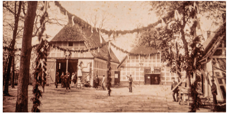
Aufnahme von der Einweihung des Kunstgewerbehauses (links) im Zuge des Scheeßeler Heimatfests von 1908

legen in der Niedersachsenrunde mit der Idee herangetreten, ein großes, öffentlichkeitswirksames Trachtenfest zu veranstalten, allerdings in seiner Heimatgemeinde Zeven. Dort, wie auch im zwanzig Kilometer entfernten Scheeßel, gab es noch Spuren eines alltäglichen Trachtenwesens, das wiederum als unmittelbarer Ausdruck der Volkskultur verstanden wurde. Dass die Wahl letztlich auf Scheeßel fiel, hatte einen ausgesprochen profanen Hintergrund: Anders als Zeven verfügte die Gemeinde seit 1874 über einen Bahnhof, war also problemlos von den Großstädten Hamburg und Bremen aus erreichbar. Zwar waren viele Protagonisten der Heimatbewegung ausgesprochene Gegner der Erschließung des ländlichen Raums mit der Eisenbahn, im vorliegenden Fall siegte jedoch der Pragmatismus.