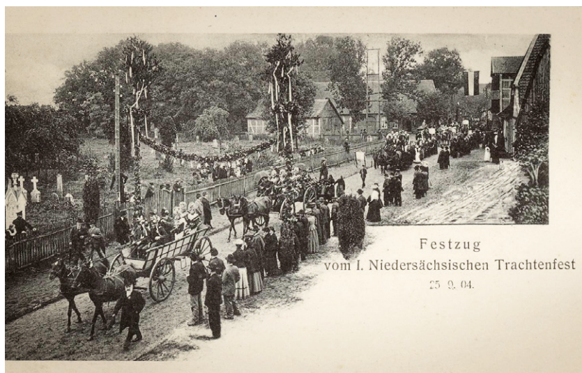
Festzug vom I. Niedersächsischen Trachtenfest 25. 9. 04.