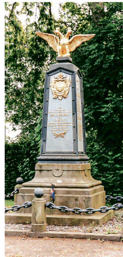
Denkmal auf dem Ritzebütteler Friedhof für die in der Seeschlacht Gefallenen