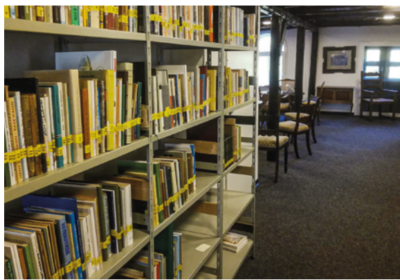
Das Bücheregal mit plattdeutschem Lesestoff im Obergeschoss der Morgensterner-Bibliothek und die Möglichkeiten zum Schmökern