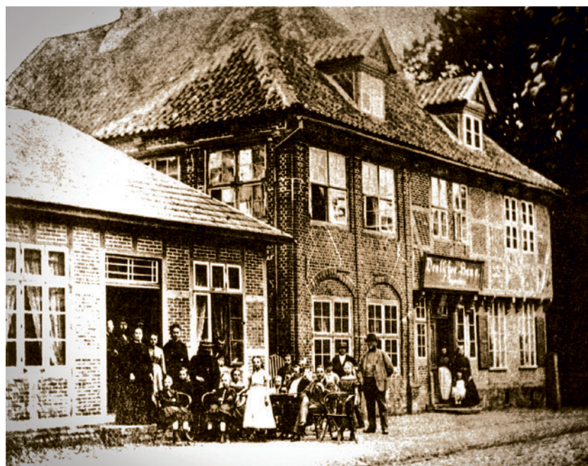
Die Feierlichkeiten nach der Seeschlacht fanden im Deutschen Haus in der Nordersteinstraße statt

Wir wurden anstandslos an Bord gelassen, ein bei der Aufgangsstelle postierter Seesoldat empfing uns und sagte, daß wir uns das Oberdeck besehen könnten, nach unten zu gehen, könne nicht erlaubt werden. Wir wurden herumgeführt von einem deutschsprechenden Unteroffizier. Die Matrosen, so wurde uns gesagt, seien fast alle Italiener und Dalmatier, die Seesoldaten (Marineinfanterie) seien Deutsche. Diese trugen Infanterieuniform aus blauem Tuch und hatten ein Gewehr; sie wurden auf den Schiffen zum Wachdienst verwendet. Beim Nahgefecht konnten sie natürlich auch ihr Gewehr gebrauchen. Diese Seesoldaten schienen mir so eine Art Polizeitruppe auf den österreichischen Schiffen zu sein. Das Oberdeck war umgeben von einer Bordwand (Brustwehr) von etwa 1 Fuß Dicke und 4 Fuß Höhe. Etwa 8 kleinere Kanonen