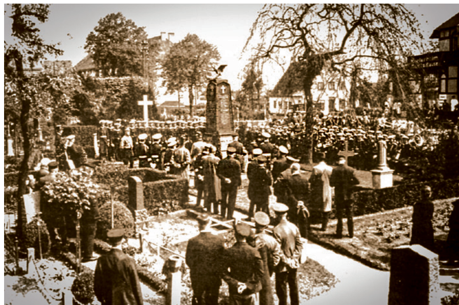
Gedenkfeier im Jahr 1934 für die im Seegefecht bei Helgoland gefallenen Seeleute