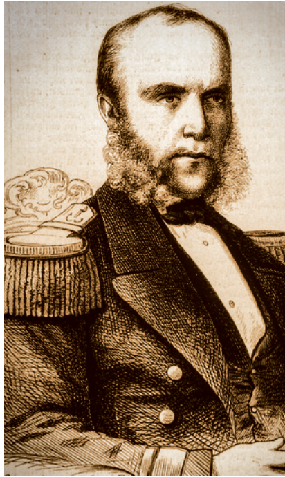
Der Befehlshaber der Flotte in der deutsch-dänischen Seeschlacht vor Helgoland 1864, Wilhelm von Tegetthoff

Gegen Mittag traf man in den Gewässern um Helgoland auf dänische Kriegsschiffe, die beiden Fregatten die Korvette. Diese dänischen Kriegsschiffe verfügten zusammen über 102 Geschütze. Das vereinigte Geschwader unter Tegetthoff besaß derer 87. Um 14 Uhr wurde das Gefecht eröffnet. Aus einer Distanz von 2.200 Metern begannen beide Seiten zu feuern. Breitseite auf Breitseite wurde in einem klassischen Parallelkampf abgegeben, wobei sich die Gegner teil-