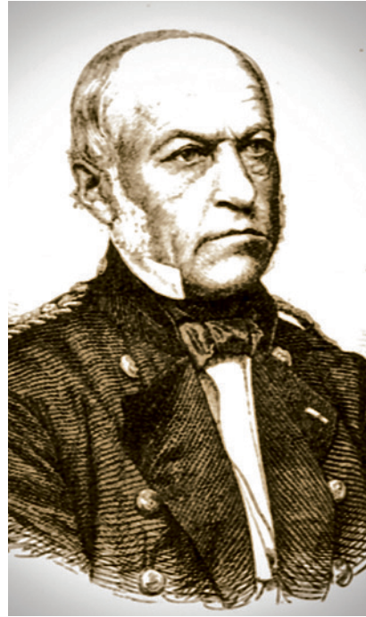
Der Gegenspieler von Tegetthoff auf dänischer Seite, Edouard Suenson (Abbildungen: Zeitgenössische Holzstiche)

weise bis auf 1000 Meter näherten. Alle an der Auseinandersetzung beteiligten Schiffe waren noch aus Holz gebaut und liefen sowohl unter Segeln als auch mit Schraubenantrieb, der mit von Kohle beheizten Kolbendampfmaschinen angetrieben wurde.