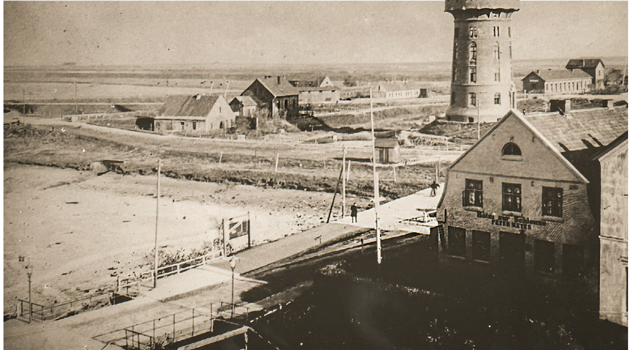
Die 1825 im Außendeich beim Wasserturm angesiedelte Reepschlägerei wurde von den Fluten vernichtet, sechs Menschen ertranken

Trotz unermesslicher materieller Schäden waren im Vergleich mit der Sturmflut von 1717 die Verluste an Menschen und Vieh diesmal weitaus geringer. Die nüchterne Bilanz von sechs ertrunkenen Menschen und einem erfrorenen Kind, sieben verloren gegangenen Pferden sowie der Verlust von 60 Stück Hornvieh, 438 Schafen und 2 Schweinen (Angaben nach Fridrich Arends) lässt auf den ersten Blick kaum erahnen, welches Leid die „Wassernoth anno 1825“ den hiesigen Einwohnern in Wirklichkeit gebracht hatte. Drei Häuser waren vollständig zerstört, 41 stark und 58 weniger stark beschädigt. Die 40 Bewohner Neuwerks hatten sich auf den Turm retten können, aber das gesamte Vieh war umgekommen.