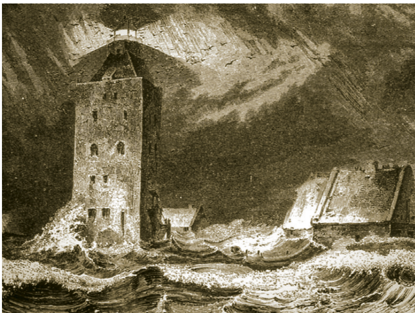
Oben: Sturmflut auf der Watteninsel Neuwerk im 19. Jahrhundert auf einem zeitgenössischen Holzstich

Die Lärmkanone auf dem Schloss signalisierte den Einwohnern höchste Gefahr. Männer, Frauen und Kinder eilten zum sicheren Schloss und mussten teilweise schon durch das hoch stehende Wasser waten. Ebenso wurde ein Großteil des Viehs zum Schloss getrieben. Morgens um 1.30 Uhr fiel das Wasser zwar, fing aber um 5.00 Uhr wieder an zu steigen. Im Morgengrauen zeigte sich den Einwohnern vom Schloss aus ein schauerlicher Anblick. Zahlreiche Viehkadaver trieben in den Fluten, in die sich eine unbeschreibliche Menge an Bauholz, Schiffstrümmern, Hausgeräten, Kleidungsstücken, Heu und Stroh gemischt hatte.