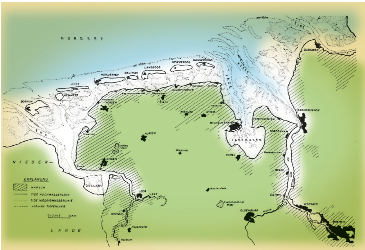
Karte der durch Sturmfluten besonders gefährdete Marschgebiete an der deutschen Nordseeküste zwischen Ems und Elbe

Wenn nur wenige Menschen zu Schaden gekommen waren, so war das dem Umstand zu verdanken, dass die Hauptdeiche im Amt Ritzebüttel vor allem seit 1786 weit über die Höhe gewöhnlicher Sturmfluten erhöht worden waren. Den Ausführungen Woltmanns im „Hannoverschen Magazin“ verdanken wir tiefere Einblicke in die Struktur und Höhe unserer Deiche zum Zeitpunkt dieser schrecklichen Flut. Dazu heißt es: „1.) Der am meisten seewärts liegende Steinmarter Deich, wo der Nordwest gerade aufsteht, und zum Theil gar kein Vorland ist, ist 21 Fuß hoch, mit der äußeren Böschung 5 zu 1. 2.) Die übrigen Ritzebüttelschen und Hadelnschen Hauptdeiche sind 18 Fuß, auf einigen Strecken bei günstiger Lage 17 Fuß hoch; und die Breite der äußern Böschung ist der vierfachen Höhe des Deichs über das Mey-