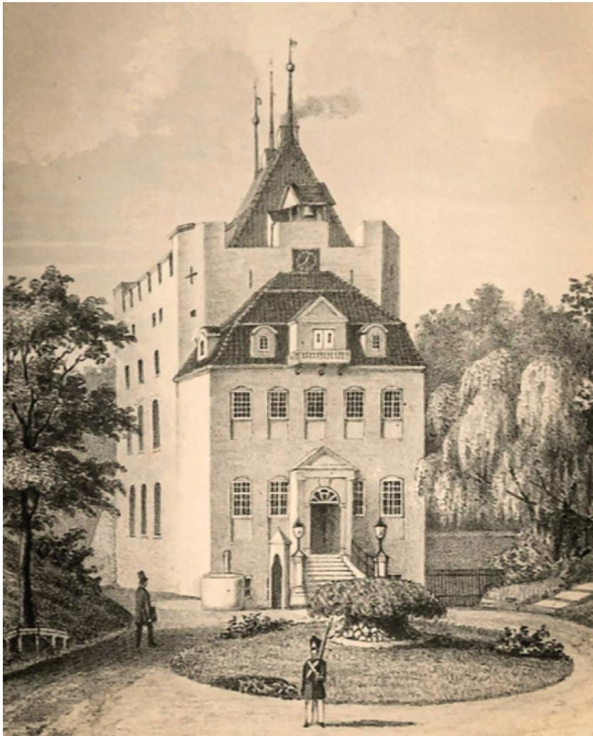
Zuflucht und letzte Rettung für Mensch und Tier war Schloss Ritzebüttel; Lithographie von Charles Fuchs