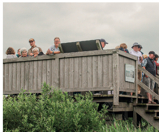
Von der Aussichtsplattform bot sich für die Besucherinnen und Besucher ein idealer Blick auf das Moor