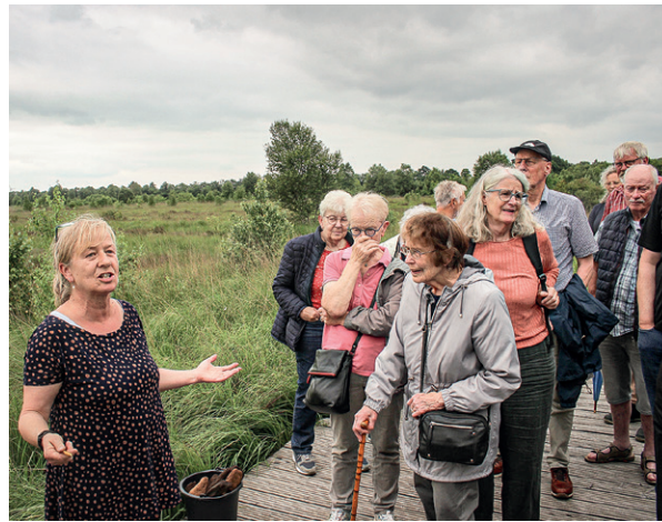
Lok- und Moorführerin gleichzeitig – die Moorführerin erklärt interessiert lauschenden Morgensternerinnen und Morgensternern das Ahlenmoor

Beim abschließenden Kaffeetrinken im Torfwerk wurden die Eindrücke und das Gehörte ausgiebig diskutiert. Alle waren sich einig, dass der Weser-Elbe-Heimattag 2025 eine gelungene Veranstaltung gewesen ist.