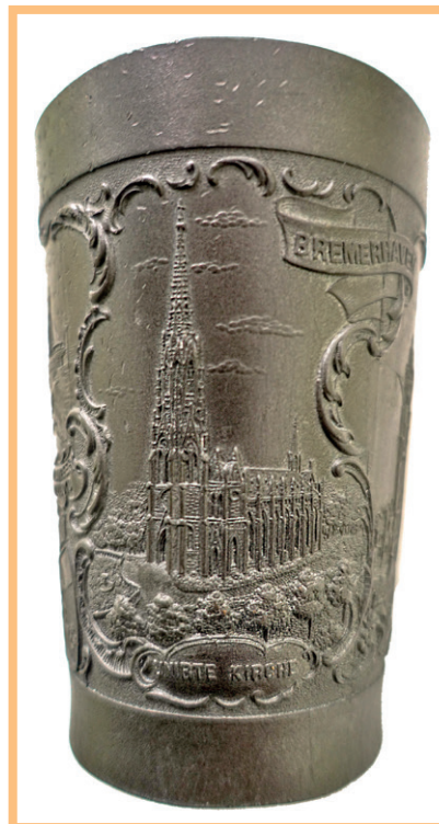
Darstellung der Unierten Kirche (heute Bürgermeister-Smidt-Gedächtniskirche) mit vollständigem Turm