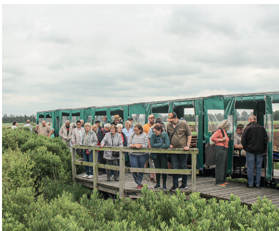
Zum Abschluss des Heimattages fand eine Moorbahnfahrt im Ahlenmoor statt