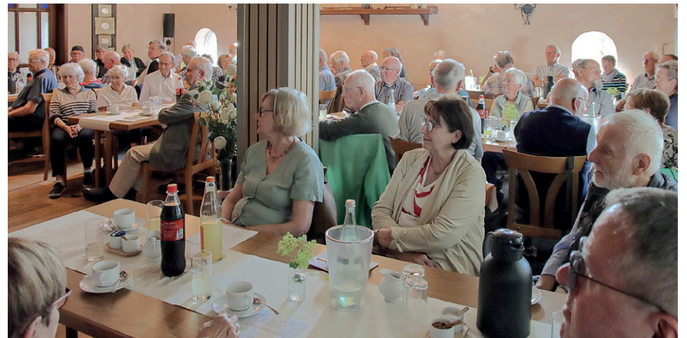
Die lauschende Zuhörerschaft in der Alten Scheune