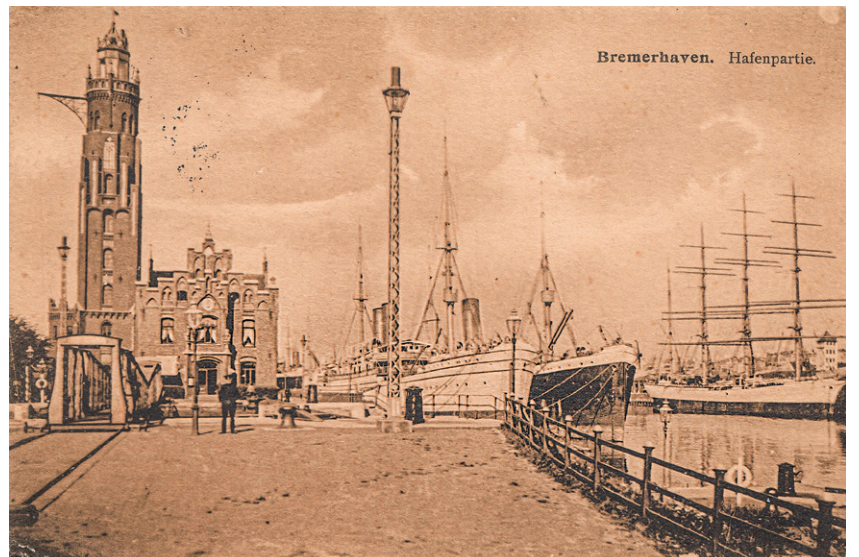
Abbildung der Schiebebrücke (links im Bild, zu Füßen des Simon-Loschen-Leuchtturms) auf einer Postkarte von 1908

weis auf das frühestmögliche Datum der Herstellung des Bechers. Der ROTHESAND LEUCHTTHURM links neben dem Stadtwappen gehörte schon damals für die Bevölkerung als Wahrzeichen zu Bremerhaven.