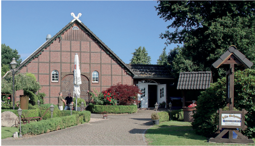
Der Tagungsort des Weser-Elbe-Heimattags der Männer vom Morgenstern, die Alte Scheune in Neuenwalde

Bilder des Treffens in Neuenwalde und Ahlen-Falkenberg am Sonnabend, 28. Juni 2025