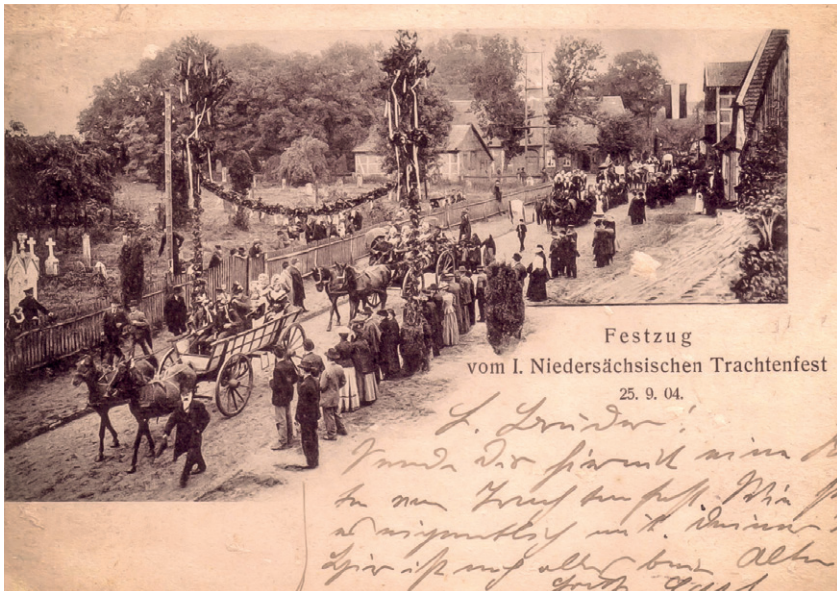
Postkarte vom I. Niedersächsischen Trachtenfest in Scheeßel