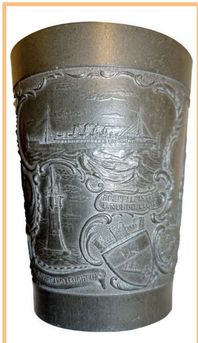
Darstellung des Leuchtturms Rotesand von 1885 und eines Schnelldampfers von 1897