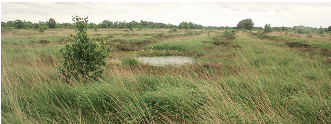
Blick über die weiten Flächen des Ahlenmoors