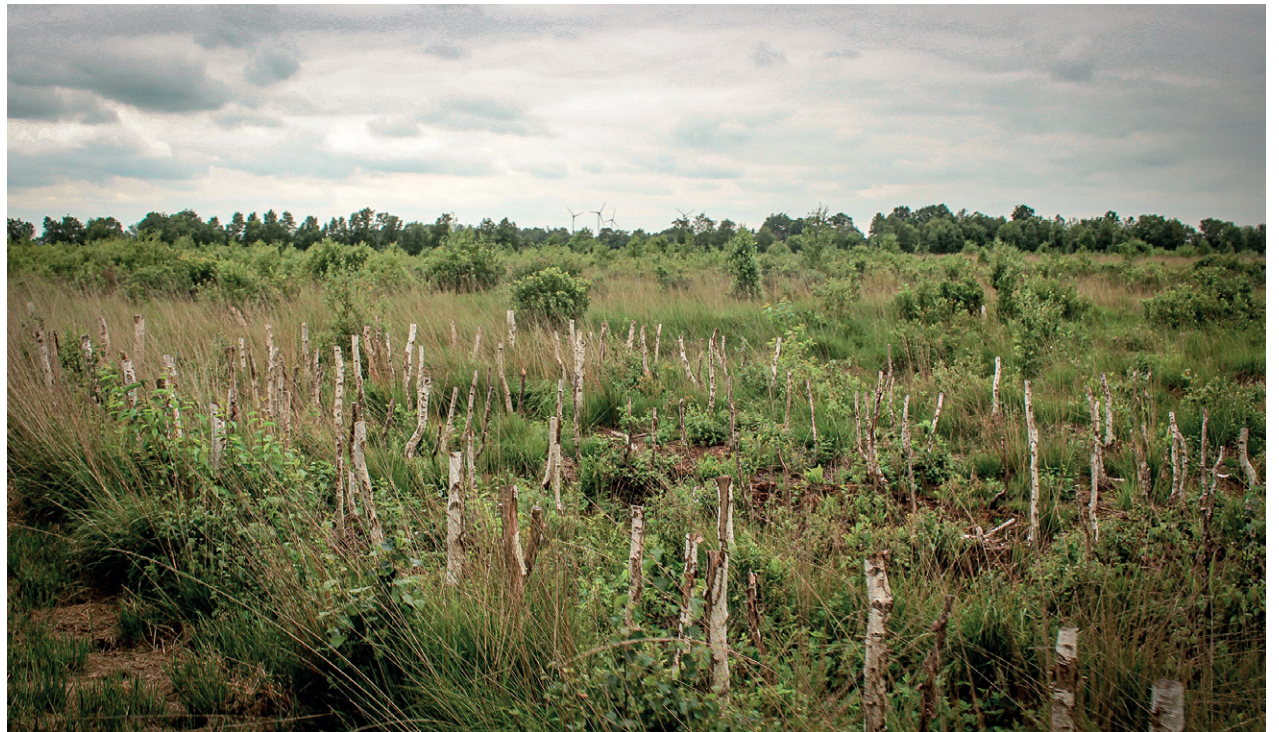
Birken im Ahlenmoor. Sie wurden auf ca. einen Meter Höhe zurückgeschnitten, damit sie dem Moor kein Wasser mehr entziehen können

Die Vorsitzende konnte über eine recht positive Mitgliederentwicklung seit dem letzten Weser-Elbe Heimattag berichten. Es traten mehr Personen in den Verein ein als verstarben. Sie forderte dennoch alle Anwesenden und auch die übrigen Mitglieder des Heimatbundes auf, sich aktiv an der Werbung neuer Mitglieder zu beteiligen, um den rasanten Mitgliederschwund der letzten Jahre aufzuholen.