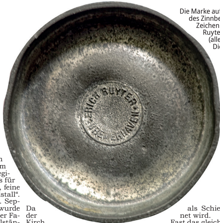
Die Marke auf dem Boden des Zinnbechers mit dem Zeichen der Firma Erich Ruyter in Bremerhaven

(Ausschnitt aus dem Buch von Manfred Ernst, Der Marktplatz, Brhv. 1988, S. 129)