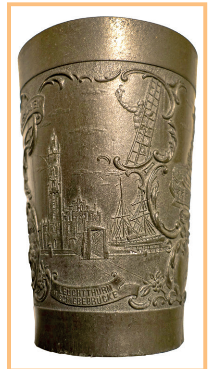
Darstellung des Simon-Loschen-Leuchtturms mit der Schiebebrücke aus dem Jahr 1887 auf dem Zinnbecher