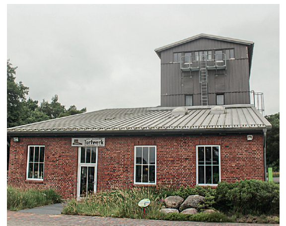
Im Cafe im Alten Torfwerk fand das abschließende Kaffeetrinken der Morgensterner statt