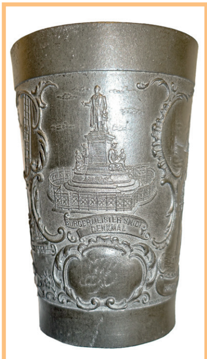
Abbildung des Bürgermeister-Smidt-Denkmal von 1888

Rechts von dem Denkmal des Stadtgründers findet man den Hin-