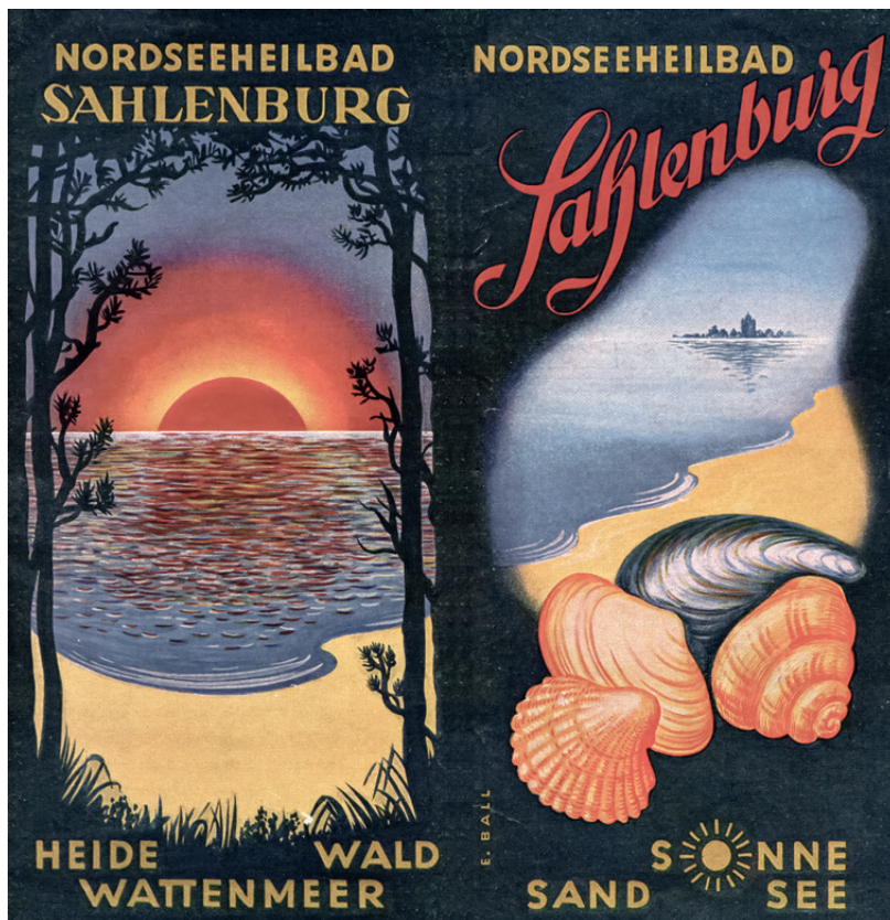
Optisch wurde fast ein wenig Südsee-Flair vermittelt: Grafiken auf einem Werbeprospekt des Nordseebades Sahlenburg aus dem Jahr 1951.

Sahlenburg bietet mehr als nur Aufenthalt am Strand. Surfer können beim ehemaligen Beobachtungsturm ihrem Hobby nachgehen. Hundebesitzer dürfen ihre Lieblinge am Hundestrand austoben lassen. Anschlie-