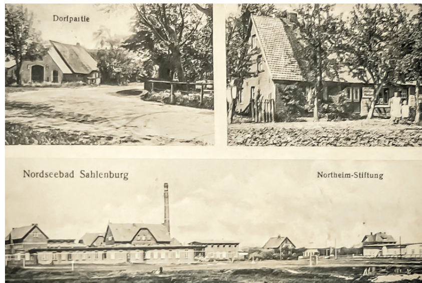
Ansichtskarte mit dem Ort Sahlenburg und der Nordheimstiftung