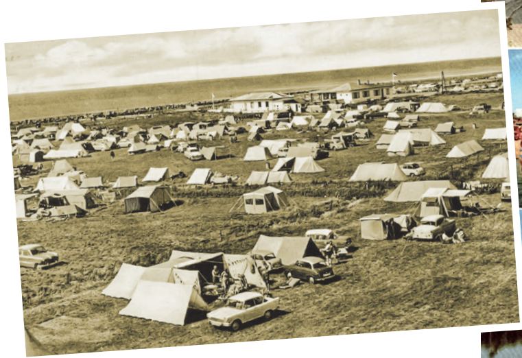
Der Campingplatz Sahlenburg mit zahlreichen, sehr bescheidenen Zelten auf einer Abbildung aus den 1960er Jahren.