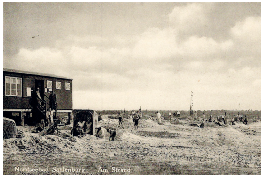
Am Strand in Sahlenburg