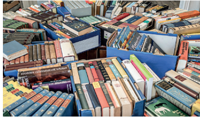
Die Bücherangebote beim vergangenen Bücherfest

bei Kaffee und Kuchen am 26. Oktober von 10 bis 17 Uhr im historischen Friesenzimmer gemütlich klönen. NBK