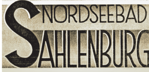
Werbeprospekt des Nordseebades Sahlenburg aus dem Jahr 1932

1992 wurde beim Freibad die „Waldbühne“ eröffnet.