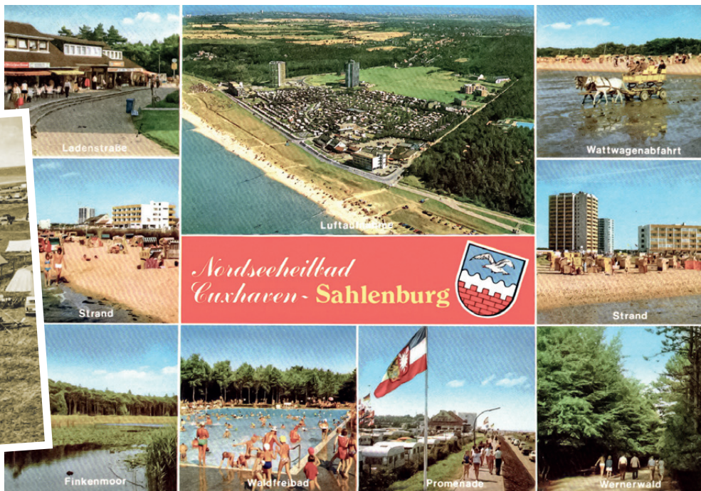
Impressionen des Nordseeheilbades Cuxhaven-Sahlenburg auf einer typischen Postkarte aus den frühen 1980er Jahre.