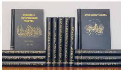
Die neuen, in Klemmbindern in der Bibliothek vorhandenen Bände